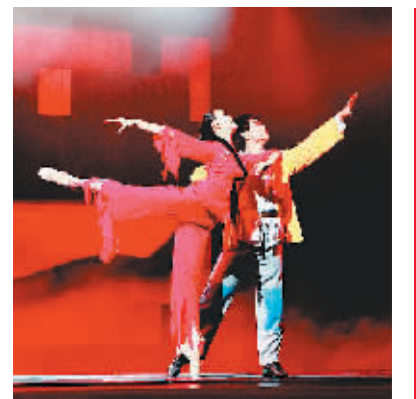
海口市艺术团演员在排练网络春晚快板书节目舞蹈。2010年12月,海口市艺术团在省歌舞剧院举行“阳光海南岛——优秀获奖作品专场文艺晚会”,精彩的演出让人对网络春晚更添期待。