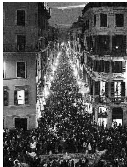
1月2日,意大利罗马著名的购物街孔多蒂大街人头攒动,市民、游客利用新年假期尽情购物。