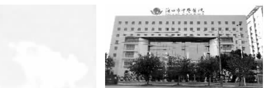
海口市中医医院新院大楼

该中心将负责海口市市区院前医疗急救服务;为大型活动提供医疗急救保障服务;承担各种突发事件的紧急医疗救援任务;与网络医院、110、119、122等应急联动机构共同建立和完善医疗救援绿色通道;指挥、协调全市医疗急救资源和负责对全市各级急救中心(站)、急救人员进行业务技术指导与培训。