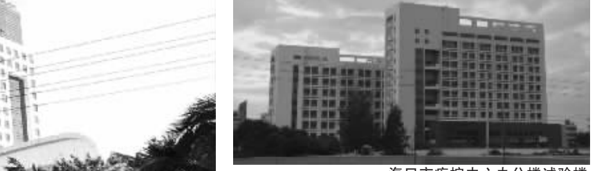
海口市疾控中心办公楼试验楼