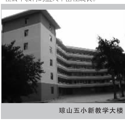
琼山五小新教学大楼