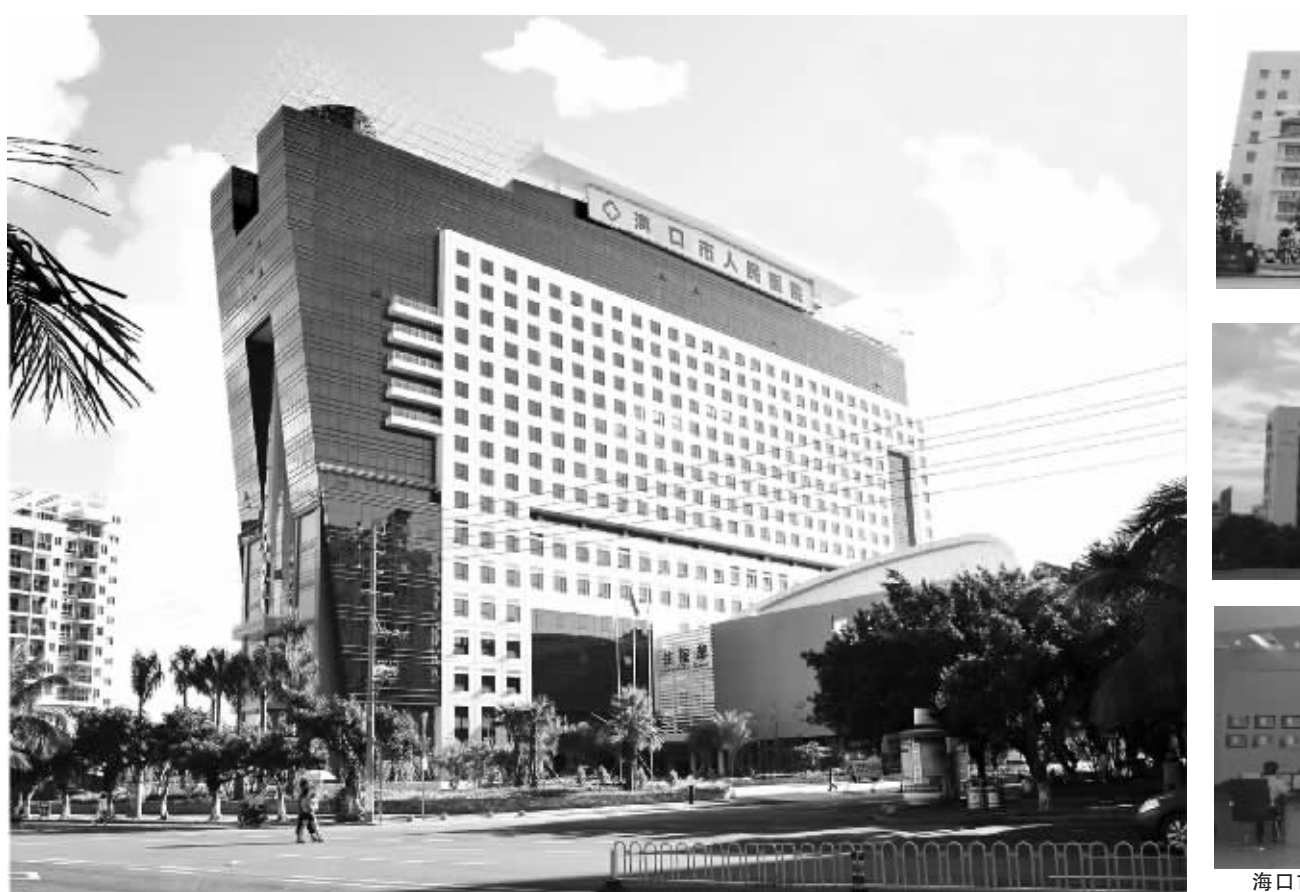
海口市人民医院医疗综合大楼

海口市中医医院金盘新院按三级甲等中医院的标准建设,以中医为主,中西医结合,是集医疗、预防、康复、保健、颐养和教学科研为一体具有慈善功能的省市级中医院。