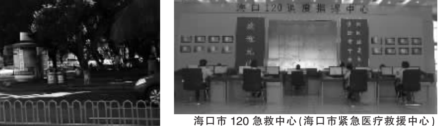
海口市120急救中心(海口市紧急医疗救援中心)现代化的调度指挥中心