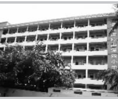
琼山四小新教学大楼

2007年12月底,海口市人大常委会组织视察小组先后深入府城地区,对该地区学位紧缺情况和部分学校周边道路建设及环境整治工作进行视察。