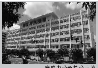
府城中学新教学大楼

琼山中学高中部:投资总额约1.58亿元新建琼山中学高中部,学校面积约207亩,建筑面积5.34万平方米。