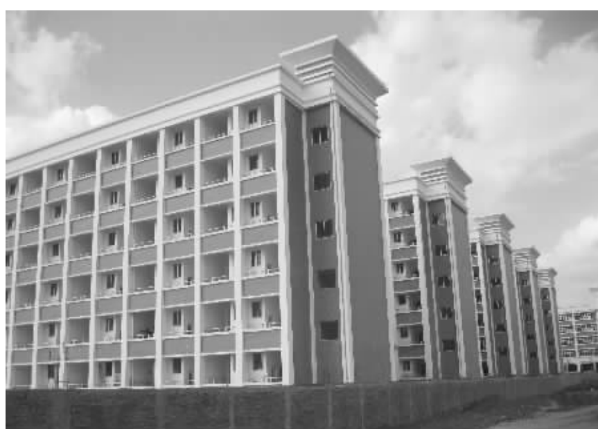
琼山中学新校区主体工程已经竣工

段学位3600个。琼山华侨中学:投资总额约6200万元建设教学综合楼,建设规模建筑面积2万平方米。