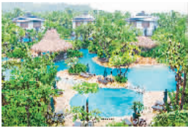
南宁石梅湾酒店内的园林景观。