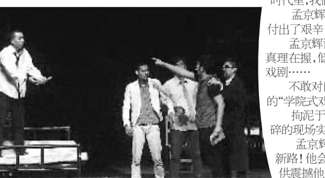
图为话剧《恋爱的犀牛》演出剧照。