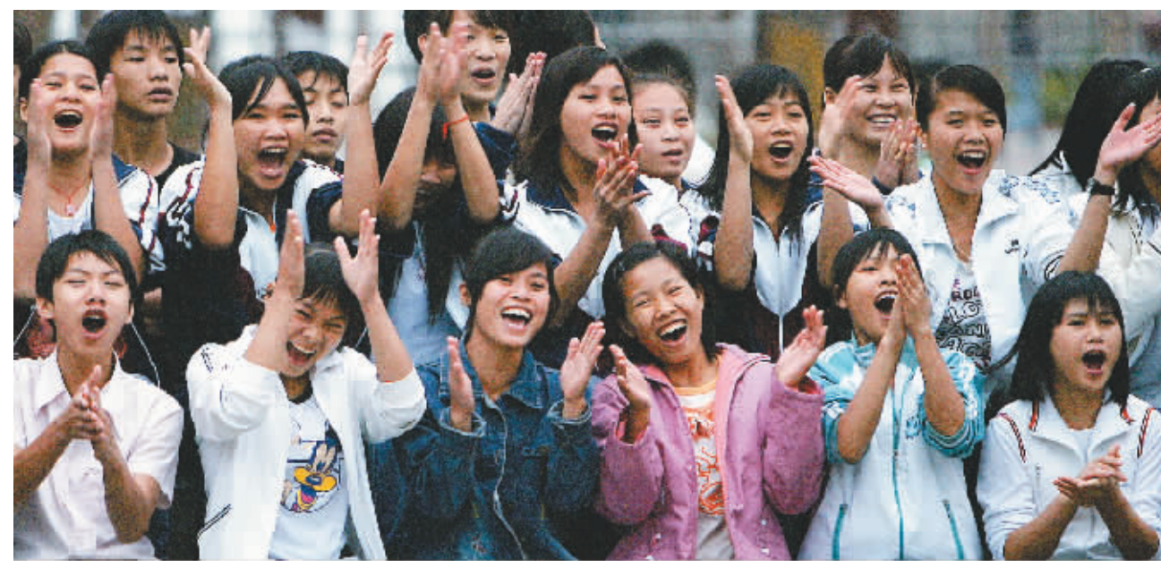
“教育移民”惠及昌江黎族自治县王下乡农民子弟。图为该县民族中学的班级篮球友谊赛上,来自王下乡的八年级十四班同学在助威呐喊。

在教育优先发展的理念下,2005年我省投入2.46亿元为全省义务教育阶段公办学校学生免除了杂费,在全国率先将“两免一补”政策扩大到城市和农村所有义务教育阶段公办学校。