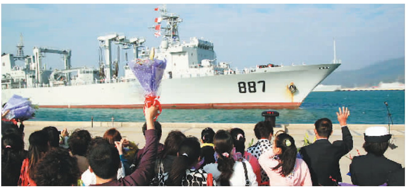
“微山湖”号远洋补给舰凯旋 在亚丁湾、索马里海域为护航舰艇补给69次,创3项纪录

“微山湖”舰于去年3月4日从三亚起航加入第五批护航编队,3月15日接替第四批护航编队正式在亚丁湾、索马里海域执行护航任务。在完成第五批护航任务后,于7月16日加入第六批护航编队。其间,该舰官兵践行勇闯大洋、连续作战、依法行动、为国争光的护航精神,大力弘扬我军特别能战斗、特别能吃苦、特别能奉献的优良传统,团结协作、迎难而上、顽强拼搏,对护航编队进行了69次补给,创造了我海军执行护航任务以来护航时间最长、补给舰护送商船最多、单日补给量最大的纪录。