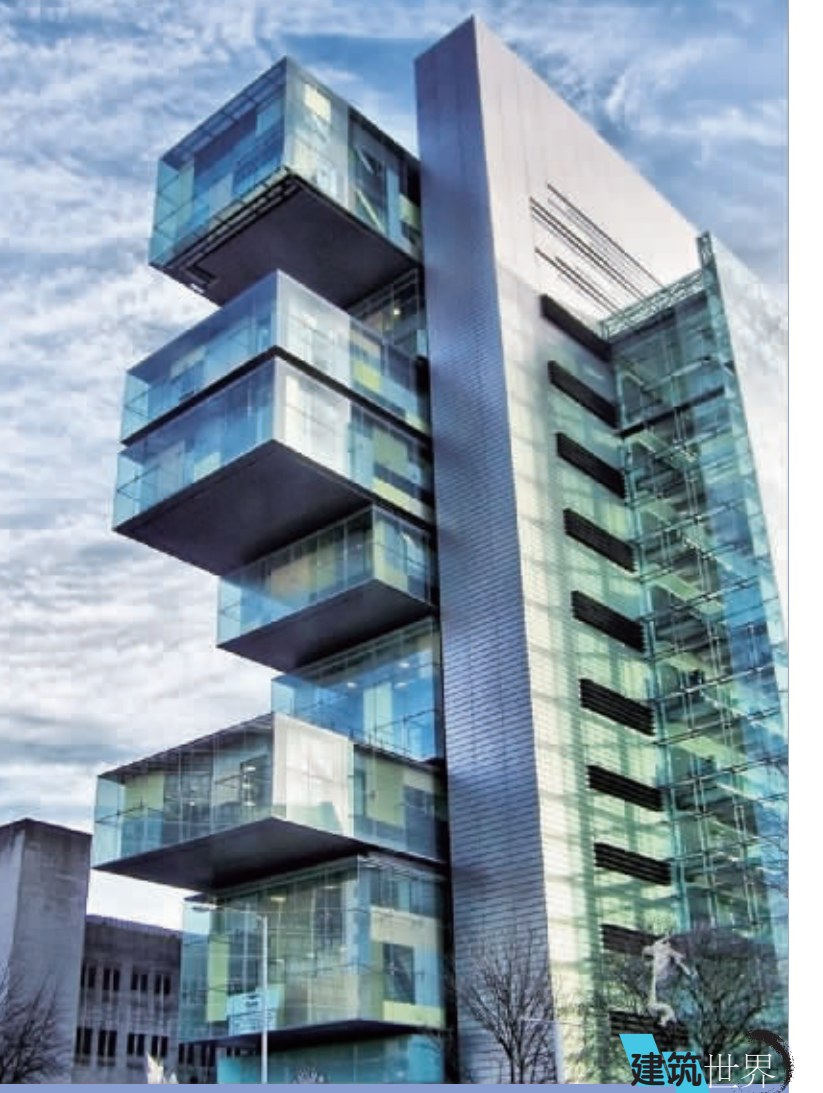
英国曼彻斯特民事司法中心 英国曼彻斯特民事司法中心是自19世纪英国皇家法院以来最大的民事司法法院。该建筑获奖不断，总获奖数达到了25个，其中就包括由英国皇家建筑师学会颁发的国家建筑奖和年度可持续奖。该建筑面积约34000平方米，共15层，有47个法庭审判室，75个咨询室，此外还有办公室和大厅。从外观看，它标志和字面显示了法院的身份；整体来讲，这个建筑是整个城市的一部分，和城市密不可分。

日前，南京市共有4家楼盘开盘，共推出800套新房源，其中城北新盘左右阳光在开盘仅4个小时过后，新推的房源全部售罄，出现了6个人抢一套房的现场。其他三家楼盘销售现场，人气也很旺盛。位于河西的盛世公馆推出的353套面积40-50平方米的小公寓，不到一个小时，100组意向客户就消化掉了70套房。(来源：扬子晚报)