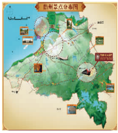
海南儋州为您呈现旅游资源盛宴

海南·恒大名都开盘在即，皇家园林、精美样板房以及豪华会所也将于近期盛大开放。届时，海南·恒大名都，秉承“尊重自然、和谐生活”的发展原则，精心雕琢的世界级皇家园林、奢华会所以及将6000道精装标准贯穿其中的满屋名牌9A精装样板房将完美展示，悠然精致生活将只为您所有！