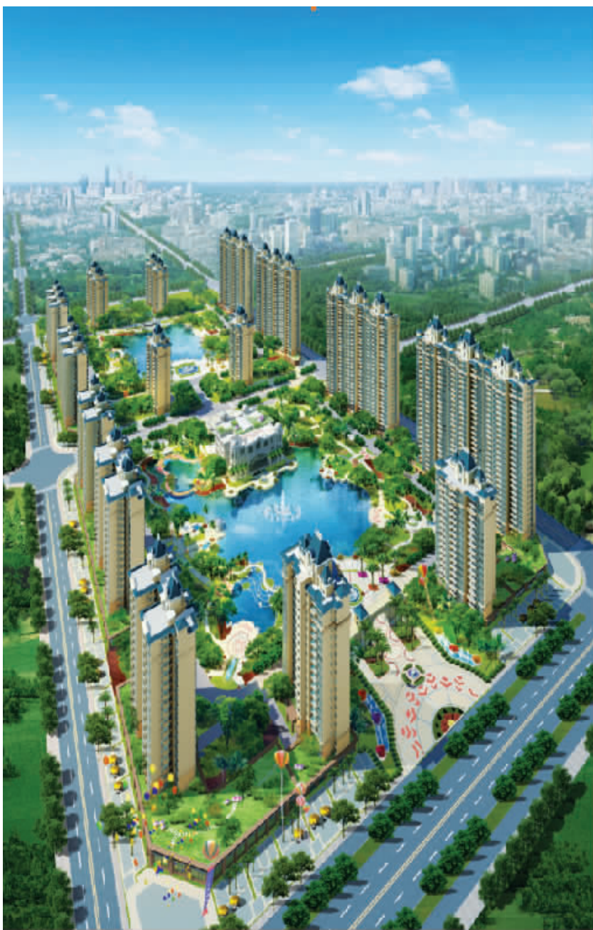
海南·恒大名都双湖水岸生活蔓延海岛西线

无一不成为购房者抢购的关键点。对于岛内常住客户而言，海南·恒大名都雄踞儋州市文化公园南侧，尊享儋州城市中