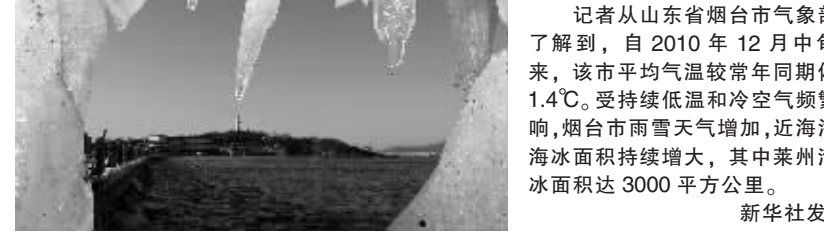
这是1月12日在烟台市海滨广场护栏上的冰凌。 记者从山东省烟台市气象部门了解到,自2010年12月中旬以来,该市平均气温较常年同期偏低1.4℃。受持续低温和冷空气频繁影响,烟台市雨雪天气增加,近海海域海冰面积持续增大,其中莱州湾海冰面积已达3000平方公里。