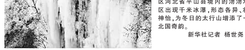
游客在汾水冰瀑景区游览。 近日,位于太行山深处革命老区河北省平山县境内的汾水景区出现千米冰瀑,形态各异,壮美神奇,为冬日的太行山增添了一道北国奇观。