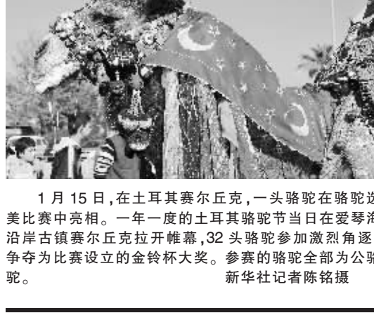
1月15日,在土耳其塞尔丘克,一头骆驼在骆驼选美比赛中亮相。