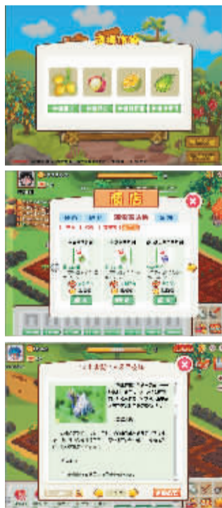
《快乐农庄》生动形象地推广海南热带瓜果的种植知识。

逐渐增多;叶面肥:新梢开始转绿,可结合防治病虫害喷施0.3%海法钾宝、磷酸二氢钾或狮马绿叶面肥,施肥方法是定植当年在树盘浅松土5厘米~10厘米淋施,肥料配方是1000:3的海法钾宝、磷酸二氢钾或狮马绿。