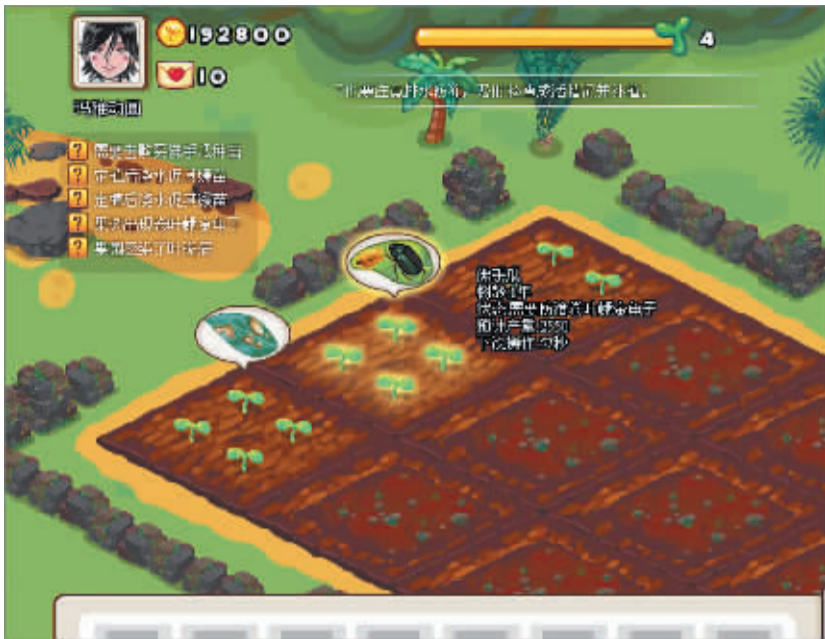
玩家在《快乐农庄》里种佛手瓜。

以蓝天和白云为背景,周边是青绿的树林,在火山石围成的篱笆内,有一块长方形的坡地,红褐色的土壤看上去很肥沃。你可以在地里种黄皮、荔枝和菠萝蜜,也可以种佛手瓜,但要跟踪“管理”,否则作物长不大,“积分”也会很少。2010年12月9日,国内首款以农业科技知识普及功能为基础,并结合展示海南热带特色农业魅力的模拟农业生产游戏——《快乐农庄》在海口开通,该游戏所依托的平台为海口市科学技术工业信息局的“电子农务网”(www.dznw.net),由海南玛雅动漫艺术有限公司开发制作。1个月来,《快乐农庄》的注册会员已有1000多人,他们当中除了善用网络的农民之外,还有不少白领和涉农商旅人士。