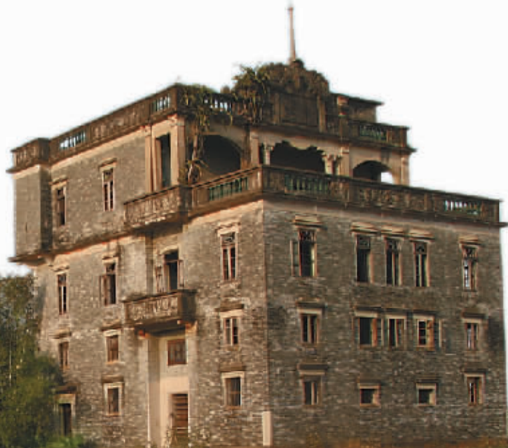
赤坎镇加拿大村梁庐。

今天，大部分的碉楼都已人去楼空，这也成为开平碉楼和村落保护中最大的难题。碉楼的主人大多已行走在世界各地，只剩下寥落的门厅、依稀可见的对联和诗画，在无声地诉说着曾经的故事。开平碉楼与村落的价值在于其背后隐藏的文化意味：那些孤独守望的美丽身影，见证了荏苒时光中的岁月流转。