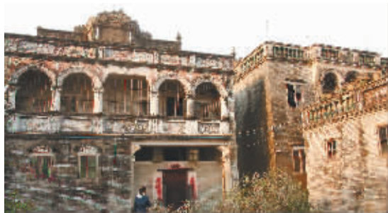
赤坎镇加拿大村俊庐楼。