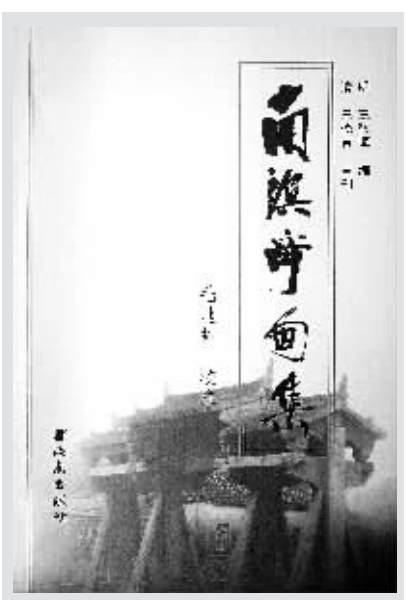
《南溟奇甸集》封面