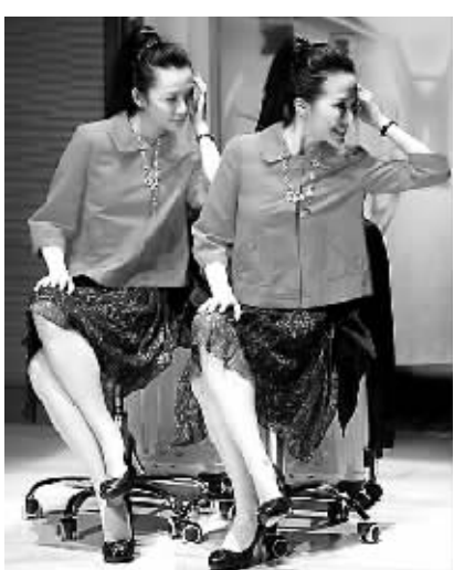
《红玫瑰与白玫瑰》（时尚版）剧照

所谓制作人制度，是目前国际通行的艺术生产管理方式，明确了制作人是院长艺术经营管理权的分解与细化，实现了以