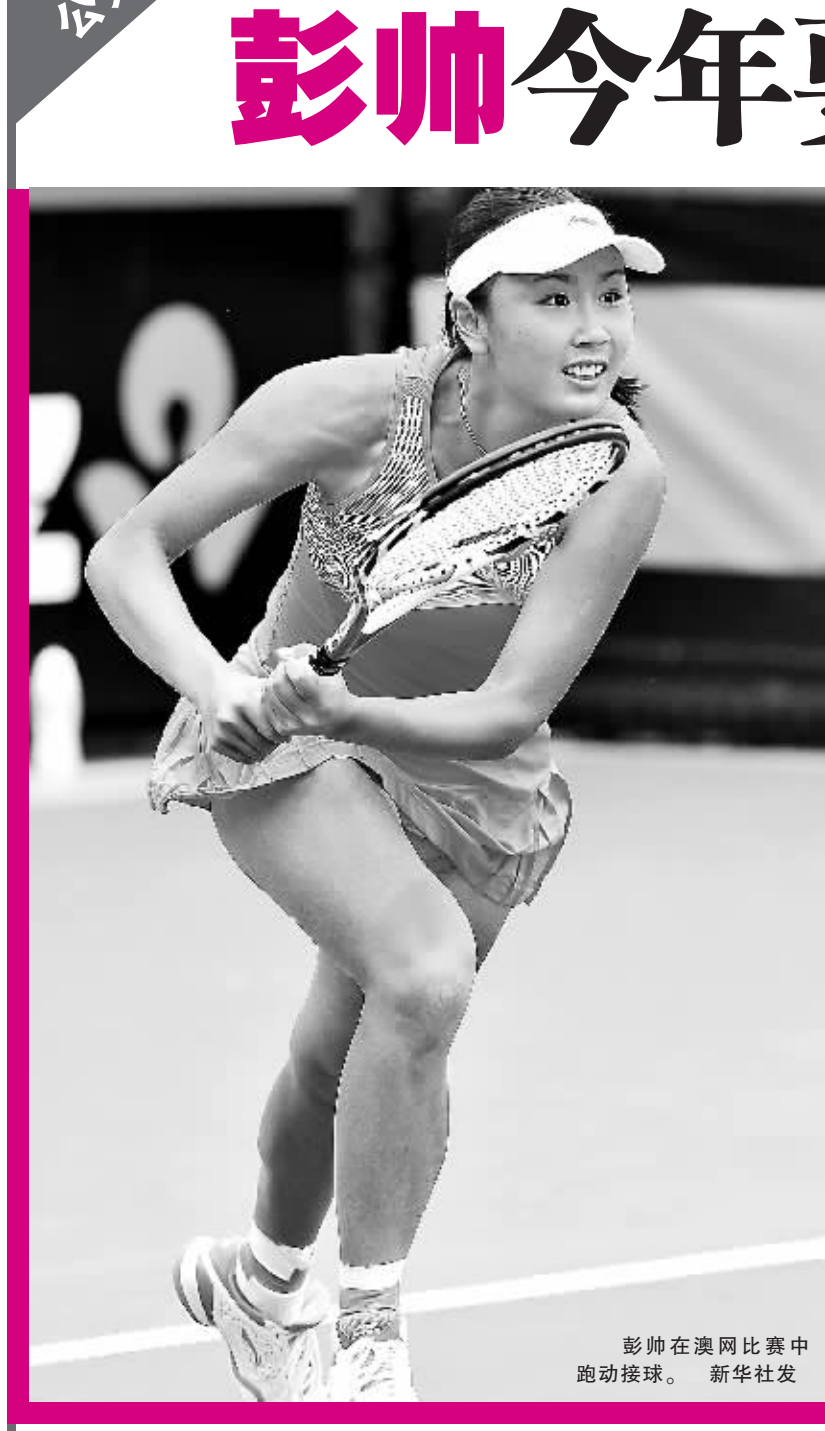
彭帅在澳网比赛中跑动接球。 新华社发