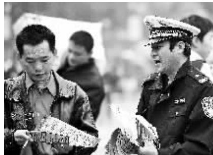
温馨服务 1月19日,海口汽车西站广场,一名执法人员给乘客发放宣传单。

1月19日,海口港,在母亲背后熟睡的孩子。随父母回家的孩子成为春运长途迁徙过程中,一道艰辛而温情的风景线。