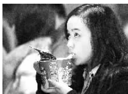
归心似箭 1月19日,海口港,一位着急回家的女孩排队验票,边抓紧时间吃方便面充饥。