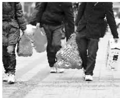
脚步匆匆 1月19日,海口汽车西站广场赶路的乘客。