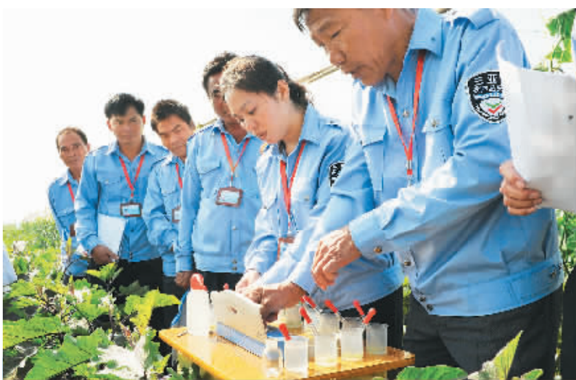
连日来,三亚市农业部门加大对冬季瓜菜的质量检控力度。1月20日,该市农业执法人员在凤凰镇瓜菜地里检测农药达标情况。

钱,他打趣道:“一会哥俩先喝一顿再回家啊。”黎明发爽快应道:“今天卖得比你多,我请客。”