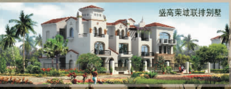
盛高荣域联排别墅