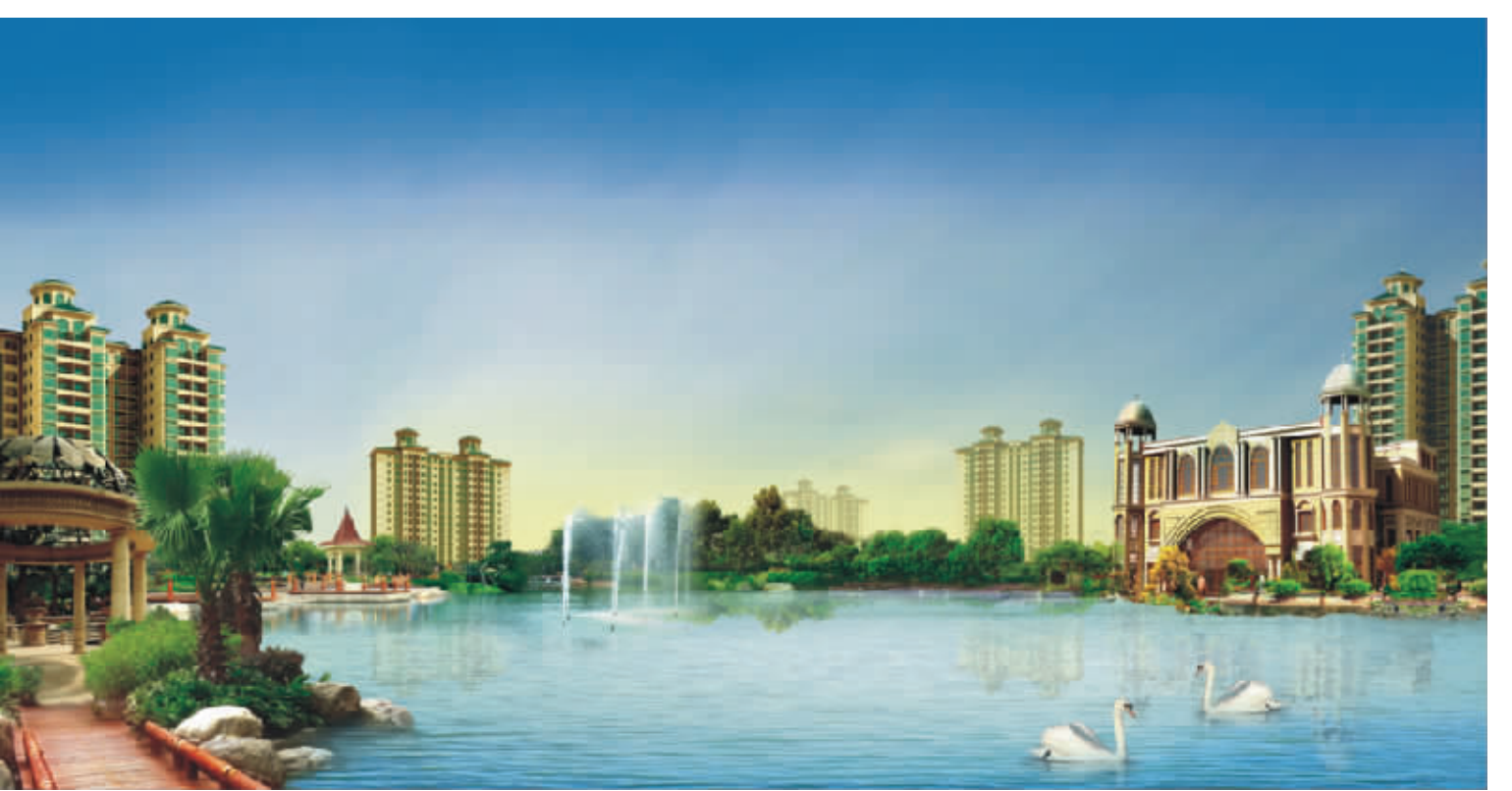
恢弘大气的建筑与欧陆宫廷式园林

海南·恒大名都，秉承“世界级皇家园林、国际级航母配套、满屋名牌9A精装”三大产品价值体系，力求打造成海南西部地标性建筑。据现场销售人员介绍，即日起项目将全面开放实景样板区，包括世界级皇家园林、国际航母级配套、约8000平米超大人工湖、9A标准精装样板间等。 海南·恒大名都斥巨资打造的生态皇家园林，经典呈现了盛行欧陆3500年的璀璨文化，原味移植欧陆宫廷园林，融经典人文、艺术、自然于一体，具有浓郁的异域风情，欧式美景近在咫尺。 皇家园林与欧式建筑恢宏布局、相得益彰，多种主题场景分布于园林内，感受生活的奇妙多姿；8000平方米中心湖景碧波荡漾，与32万平米建筑群交相呼应。叠水瀑布、超大绿地、咏荷喷泉、珍贵植物、典雅雕塑、中央湖景、主题场景等元素，营造出错落有致、层次分明的流动风景，将皇家湖景园林的气派美妙演绎得淋漓尽致。 海南·恒大名都整个社区绿化率高达45%，植物品种超过30种，精心挑选的树木在园艺师的悉心照料下茁壮成长，银海枣、罗汉松、白兰等名贵品种镶嵌在皇家园林的每一个角落，移步易景中尽显居者的尊贵气质。在海南·恒大名都，高端精品不只是房子，更体现在生活环境中每一个细节。 海南·恒大名都汇聚了全国顶级的设计师，特创恒大独有的9A体系，在项目设计、施工、监理、验收等各个流程，与几十家国际品牌组成战略联盟，