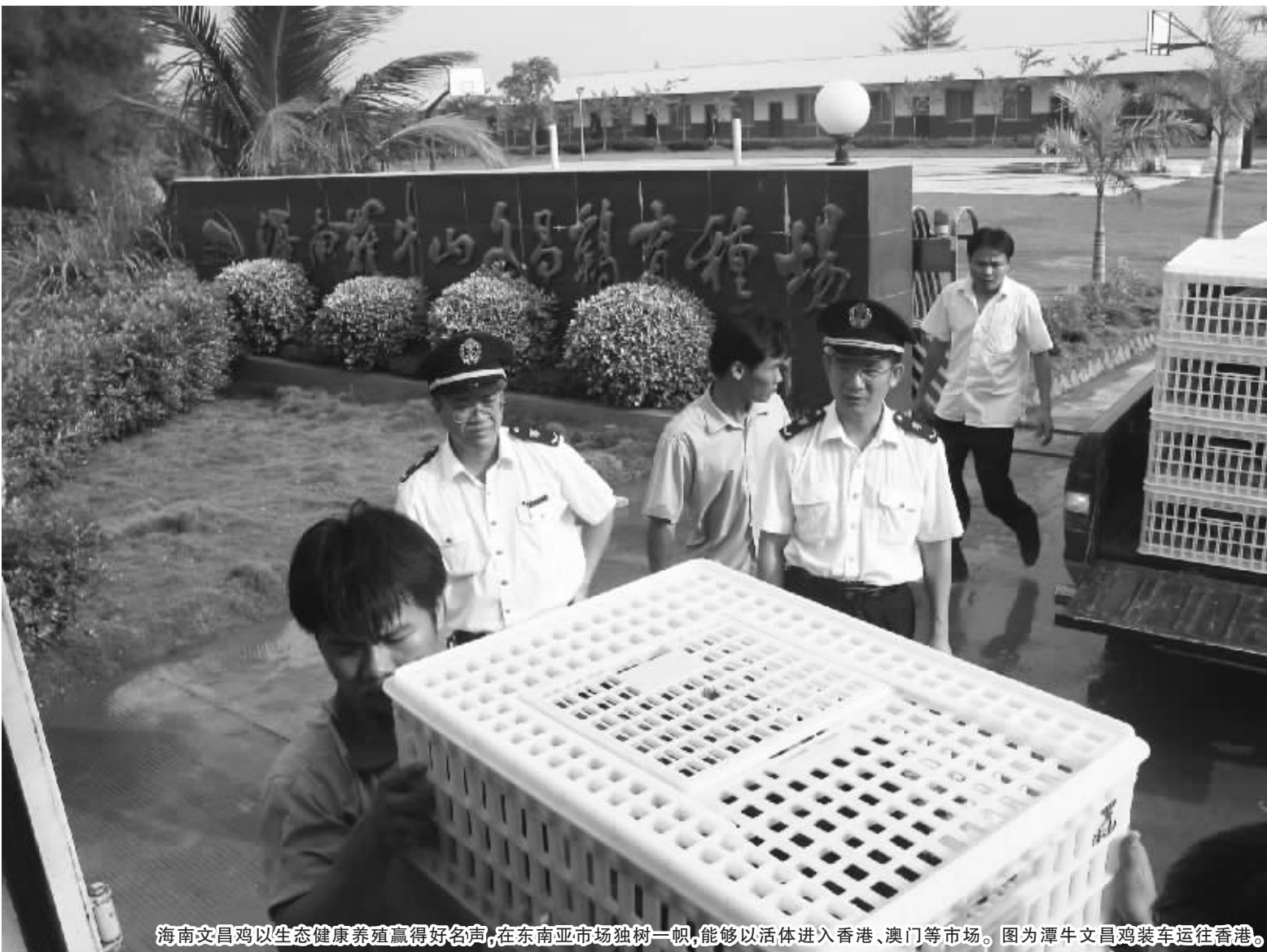
海南文昌鸡以生态健康养殖赢得好名声,在东南亚市场独树一帜,能够以活体进入香港、澳门等市场。图为潭牛文昌鸡装车运往香港。