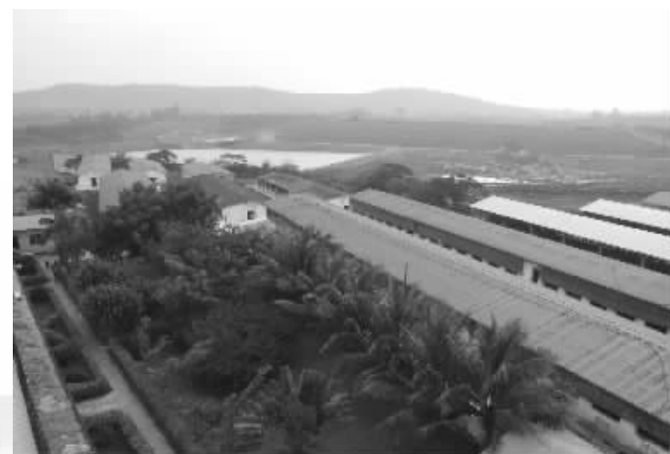
海南鑫柯畜牧业有限公司昌林万头猪场养殖的生猪多数供应香港。