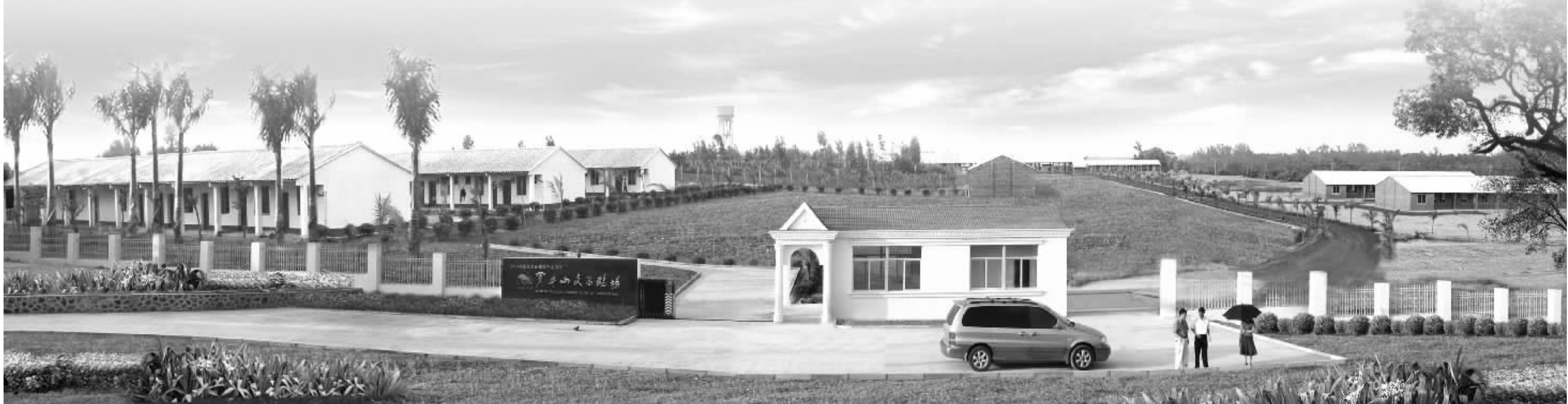
潭牛文昌鸡养殖场以生态健康的优势,获得新加坡客商青睐,在第十三届冬交会上获得4000万只的出回合同。