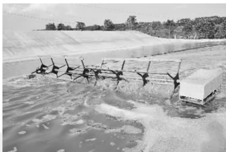
桐花香猪场以沼液养螺旋藻,种地瓜和桐花树,又用螺旋藻、地瓜、桐花喂猪,所生产的猪是国内高品质猪的代表。图为猪场螺旋藻养殖池。