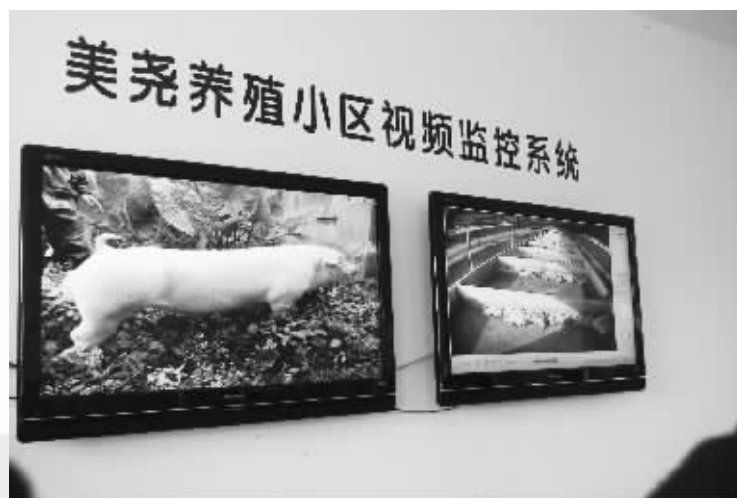
桐花香、海平达、美健等17家标准化规模养殖场安装视频系统,自动监控生产流程,提高畜产品质量安全水平。

海南猪、文昌鸡、东山羊、嘉积鸭等优势产品远销北京、上海、广州、香港、澳门等重点城市。海南畜禽实现从进岛到出岛的历史性跨越,生猪出岛累计565万头,文昌鸡出岛累计1.1亿只,其中儋州市连续四年获得国务院“生猪调出大县(市)奖励”。