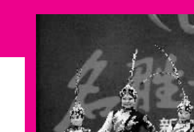
1月31日,为迎新春,新加坡演员在表演杂技《俏花旦抖空竹》。

在贺词中,各国政要不约而同感谢华裔对当地多元文化的贡献,并在促进本国经济发展、密切所在国与中国关系等方面,对华裔寄予厚望。 加拿大总理向华人贺新春已有十几年历史,哈珀在今年的贺词中称,加拿大华裔民众迎接农历兔年丰富多彩的庆祝活动,是多元文化和平世界的象征。 澳大利亚总理吉拉德盛赞近70万名旅澳华人“从不放弃自己的信仰和希望,在各自的领域做出了突出的贡献和成绩”。她称,“2011年开始的新10年,是中国继续在上世界扩大影响力的10年,很自豪澳洲能与同行,成为她的亲密旅伴”。 吉拉德还多次提到“旅途”一词,用以形容移民在新的国度中对新生活的追求,以及澳中两国进一步携手合作的明天。 日本首相菅直人向全体在日华人祝贺新年时表示,日中两国正在一道为充实“战略互惠关系”而付诸努力。不仅需要两国高层及政府间的合作来提高相互信任关系,亦需要在广泛领域不断积累国民层次的交流,构筑起国民间的相互理解 and 相互信赖关系。 菅直人特别提到,今年恰逢辛亥革命100周年,其领导者孙中山先生曾让许许多多的日本人为之深切铭感和强烈共鸣,诸如此类的友谊事例日积月累构成了今天中日关系的基础。从促进日民间交流及相互理解的角度而言,现在活跃和贡献于日本社会各个领域的华人亦发挥着非常重要的作用。 英国首相卡梅伦在新年贺词中表示,兔年与家庭以及和平相关,而在某种程度上,新的一年也将是艰难的一年,世界正在迈入确保经济稳定与繁荣的艰苦旅程,他相信,“如果我们共同努力将会变得更为强大”。 卡梅伦将中英关系称为“共同增长的伙伴关系”,并向英国的华人社会致敬。他认为,华人对英国做出了巨大的贡献,其成功的故事在各领域随处可见。他们“努力工作、企业精神、社区融合”的价值观,也正是英国所需要的。(来源:新华网)