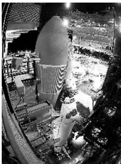
1月31日,在美国佛罗里达州肯尼迪航天中心,“发现”号航天飞机即将被运往发射架附近。“发现”号计划于2月24日发射,完成其最后一次飞行。