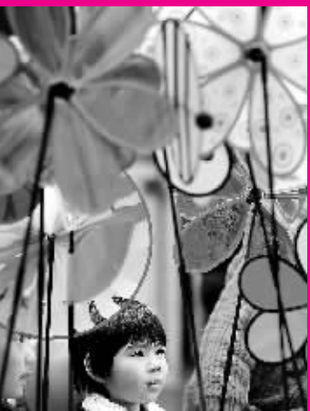
1月30日,在美国旧金山唐人街举行的元宵花市上,两个孩子走过一个卖风车的摊位。

新华社专电 索马里首都摩加迪沙,工作人员将一名伤者运抵医院。索马里警察部门和医院的消息说,索马里政府军内部31日发生交火事件,已造成至少17人死亡、多人受伤。