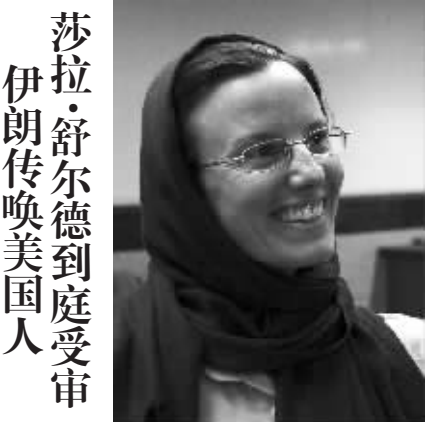
1月31日,伊朗司法部门发言人穆赫辛·埃杰耶德说,伊朗法庭已经传唤去年9月获释出狱的美国人莎拉·舒尔德到庭受审。

据新华社开罗电 由埃及总理沙菲克领导的新政府成员1月31日向总统穆巴拉克宣誓就职