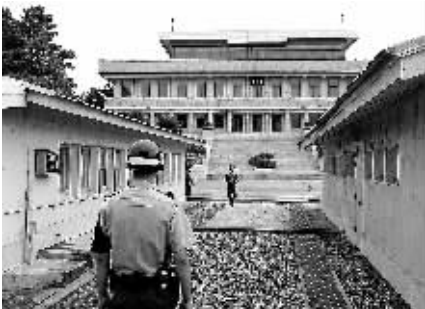
据韩国联合通讯社2月1日报道,韩国与朝鲜同意于2月8日在板门店举行军事会谈的预备会谈。图是板门店的资料照片。