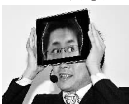
2月1日,一名日本魔术师在东京用苹果 iPad 平板电脑变魔术。