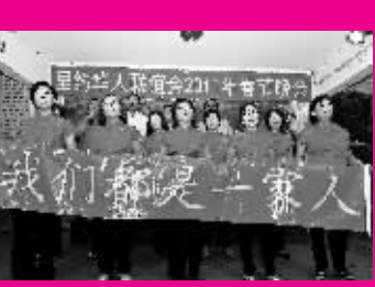
1月30日,在巴西里约热内卢举行的春节晚会上,华人华侨演唱歌曲。

新华社金边2月1日电(记者张瑞玲、雷柏松)柬埔寨金边市法庭1日分别判处“泰国爱国者网络”领导人威拉和泰国女记者拉蒂8年和6年有期徒刑。金边市法庭当天以涉嫌犯有非法入境罪、非法进入军事禁区罪和非法收集国防安全情报罪,对威拉和拉蒂的案件进行审理。法官最后宣布上述罪名成立,数罪并罚,判处威拉有期徒刑8年,罚款180万瑞尔(约合450美元),判处拉蒂有期徒刑6年,罚款120万瑞尔(约合300美元)。