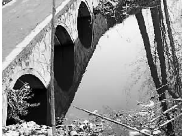
爆炸谣传是引子 恐慌背后有原委

10日凌晨，因为谣传江苏响水县生态化工园区发生爆炸事件，导致方圆十多公里内上万名群众惊慌出逃，引发多起车祸，已有4人死亡、多人受伤。为弄清事件真相，“新华视点”记者11日现场采访发现，尽管谣传所指“化工厂爆炸”并未发生，但当地许多群众依然惊魂未定。据了解，响水县化工园区近年来发生过两起导致多人伤亡的安全事故，所以一有风吹草动，就容易引发群众神经紧张。