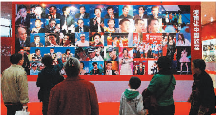
↑“黄金五年”——海南让中国欣喜。