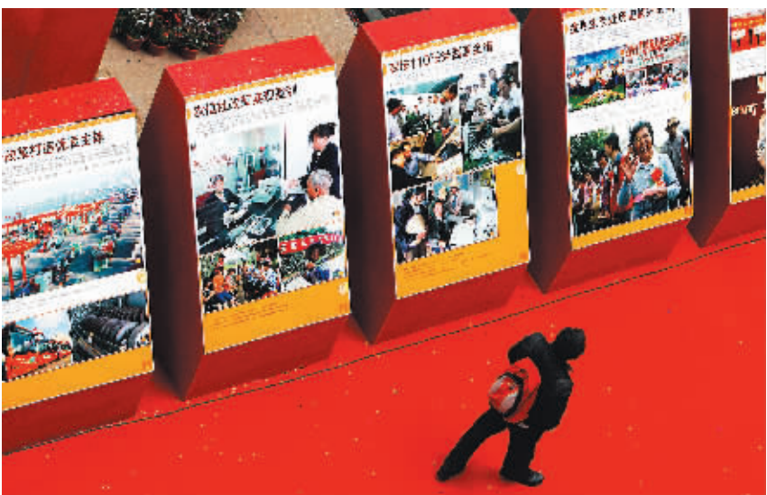
↑省博物馆展厅内,市民在观看展览。