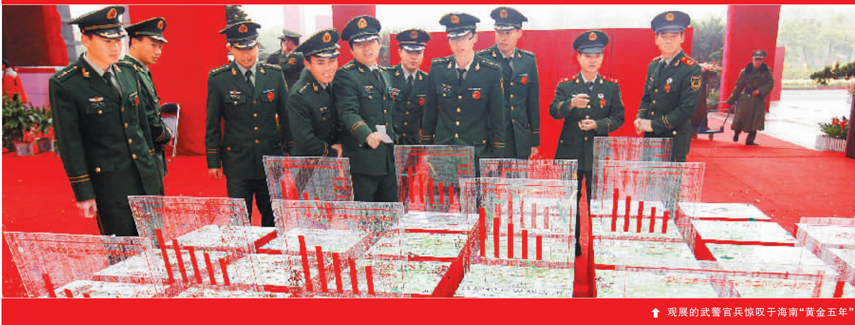
↑观展的武警官兵惊叹于海南“黄金五年”。