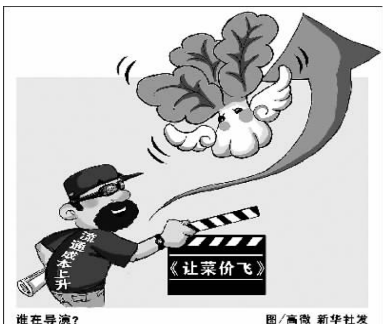
谁在导演?

记者春节前提携一辆蔬菜运输车从海南进京,行程2800多公里,目睹了一车辣椒从海南田间到北京农贸市场的价格上涨过程。其中每公斤蔬菜从海南进京的流通费用,仅包装费、冷库预冷费、装卸费、运费合计就要1.42元。也就是说,在海南收菜即使一分不要,运到北京价格每公斤也不会少于1.42元。