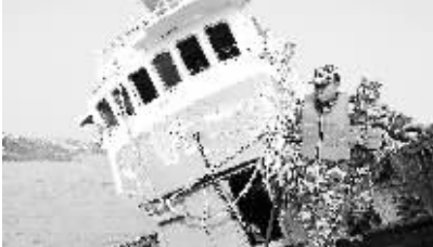
2月20日,在浙江玉环坎门港,边防民警在韩国渔船上检查。

2月17日10时许,浙江省玉环县渔政“浙玉渔1577号”在海域作业时,发现一艘侧翻的韩国渔船,搜索四周并未发现落水船员。经边防、海事和渔政等部门商议,“浙玉渔1577号”渔船和“浙玉渔运633号”渔船从17日14时许起,经过70多个小时的努力,于20日15时许将侧翻的韩国渔船安全拖到玉环坎门港。