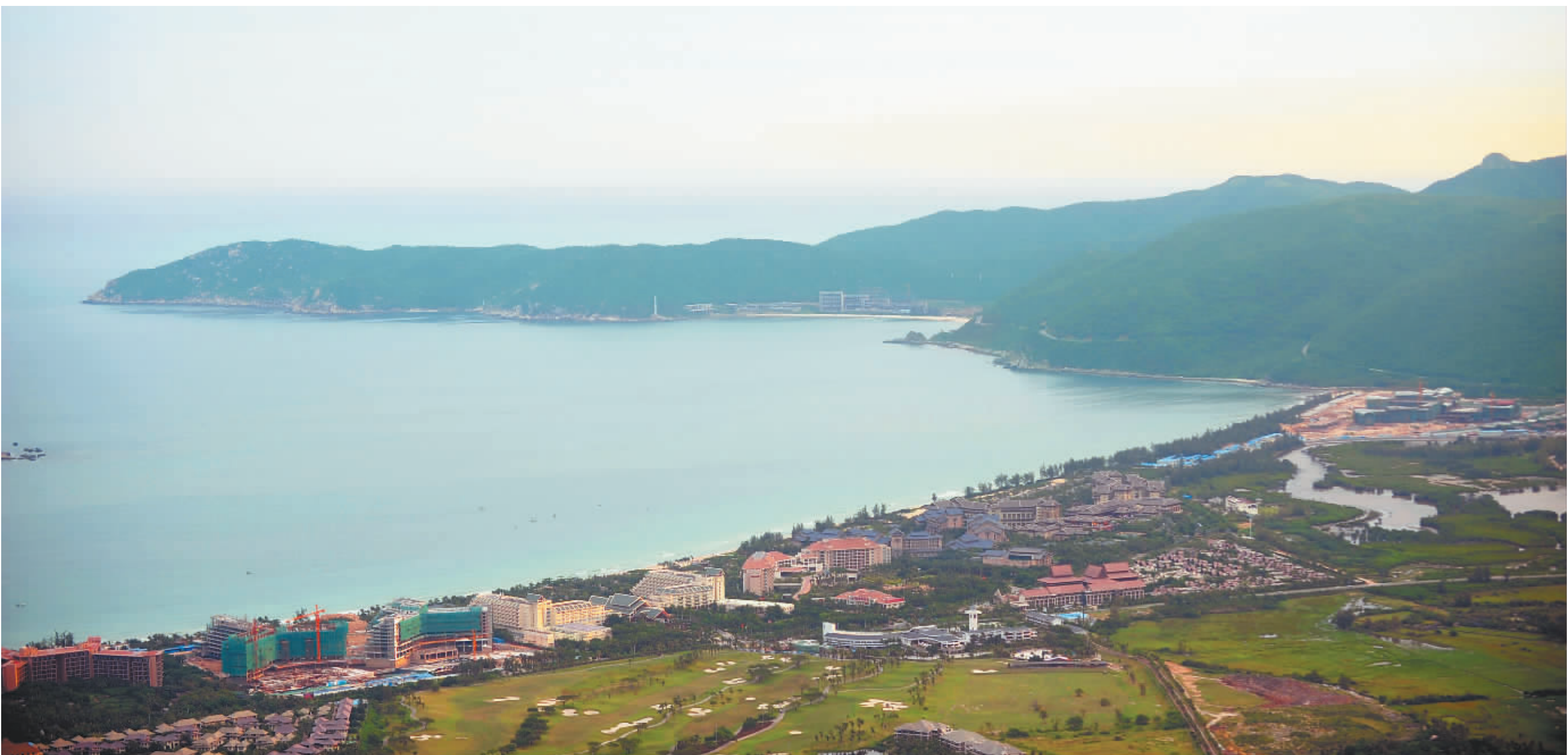
三亚海边的五星级酒店群。

一座座依海而建的度假酒店,以蓝天碧海为背景,美轮美奂,成就了独具特色的海南景观。来海南的各地游客会告诉你,让他们心旷神怡的不仅有碧海蓝天,还有成群成片、颇为壮观的高端度假酒店群。