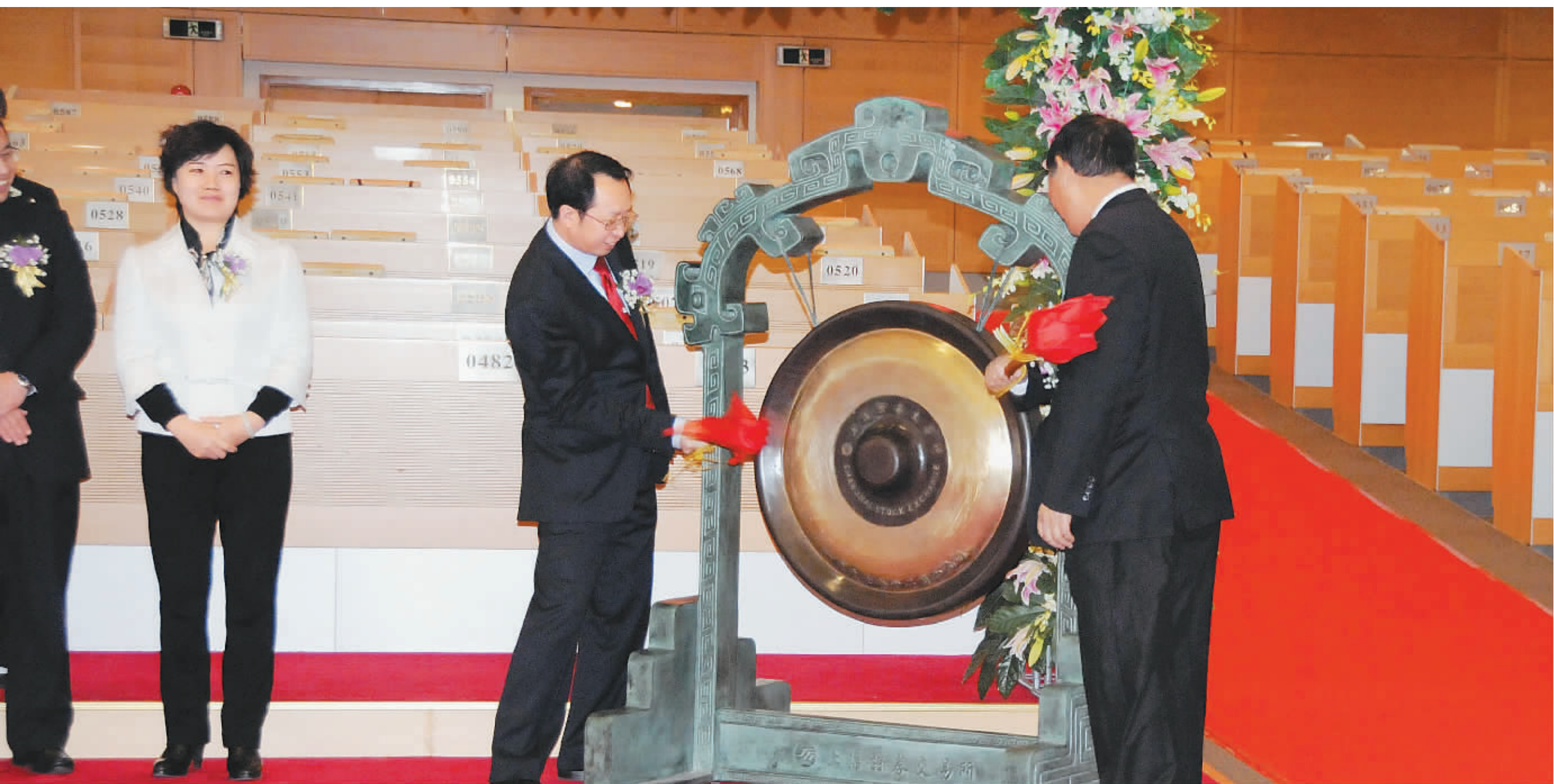
今年1月7日,我国最大的天然橡胶生产企业海南橡胶集团在上海证券交易所挂牌上市。

今年1月7日,上海证券交易所多了一支代码601118名为海南橡胶的股票,中国证券市场的农业板块,也有了唯一以天然橡胶生产加工为主业的上市公司。