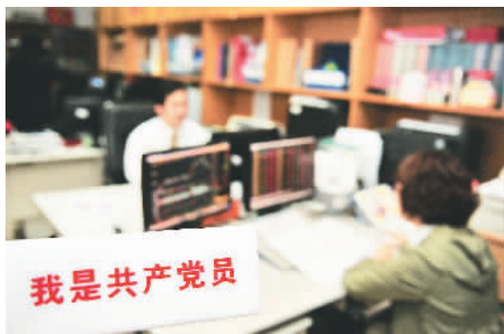
海口一家证券营业部内,“我是共产党员”的牌子摆放在办公桌上。

家难”活动,使社区党组织的凝聚力和影响力不断提升。 近年来,我省各地社区党组织围绕“三有一化”的要求,依托政府