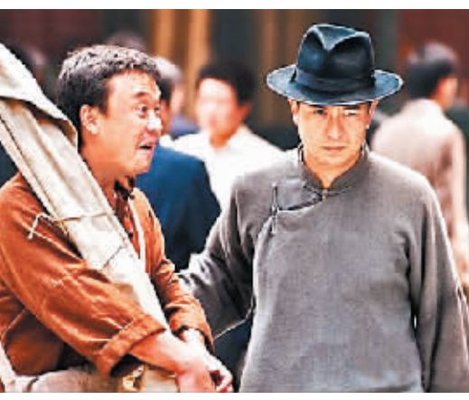
张嘉译(右)在《借枪》中

本报讯 23日下午,由《潜伏》原班人马打造的年度谍战大戏《借枪》在上海东方卫视召开了开播发布会,导演姜伟携主创张嘉译、罗海琼等人亮相,该剧将于3月3日起亮相北京、上海、天津、浙江等各大卫视。从《蜗居》《你是我的兄弟》中走出,原先有些富态的张嘉译在剧中已变成消瘦的熊阔海。为了扮演这“史上最富态的地下党员”,张嘉译进组十多天暴瘦了近十斤。他说:“孙红雷演的余则成条件优越,而我这角色却很‘草根’,吃饭经常有上顿没下顿,甚至要让媳妇当了衣服换面条吃,充满了平凡人的生活细节和黑色幽默。”由于《借枪》是继《潜伏》后,导演姜伟和原著作者龙一的再度合作,人们也自然地把张嘉译和孙红雷的《潜伏》进行比较。对此,张嘉译说,能演《借枪》是一种幸运,他扮演的地下情报人员熊阔海原是相声演员,有一股江湖气,走路甩臂摆胯,还爱插科打诨耍贫逗贫,表面油滑,内心正直,他和《潜伏》中那个少言寡语、冷静缜密、受过高等教育的余则成完全不同,同样玩“潜伏”,余则成有组织的强大后盾,而熊阔海还得自己打工来挣活动经费。张嘉译说:“余则成是最华丽的潜伏者,而熊阔海是最窘迫的潜伏者,但两人在精彩程度上,完全可以平起平坐。”张嘉译说,这个人物还有多面性,“我好像在一部戏里演了5个人,这对我来说是个挑战。”(余承)