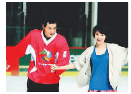
《单身男女》将作为开幕电影之一,图为剧照。

据新华社香港2月24日电(史洁明)香港国际电影节协会24日宣布,第35届香港国际电影节将于3月20日至4月5日在香港举行,期间将放映来自全球56个国家和地区的335部电影,其中包括59部世界、国际或亚洲首映电影。香港国际电影节协会主席王英伟在当日举行的记者会上说,今年香港国际电影节的主题是“Let's Meet Here”(电影节见),邀请来自不同地域、文化的人和电影一同参与。他说,香港国际电影节踏入第35周年,已经获得全球电影业界的重视,被公认为亚洲地区推出新作的重要平台。王英伟当日还公布了今年电影节的两部开幕电影:《单身男女》及《香港四重奏II》。据主办方介绍,本届电影节共计447场次,电影335部,其中包括19部世界首映电影,5部国际首映电影以及35部亚洲首映电影。另外,本次电影节放映名单包括多部荣获奥斯卡提名的影片,完全修复的经典电影以及影坛新秀的创意作品,为观众提供不同口味的电影大餐。香港国际电影节1977年创立,每年的电影节都为观众带来大量新片及经典回顾节目。本着发掘新秀的宗旨,电影节优先放映一系列中国及亚洲电影。