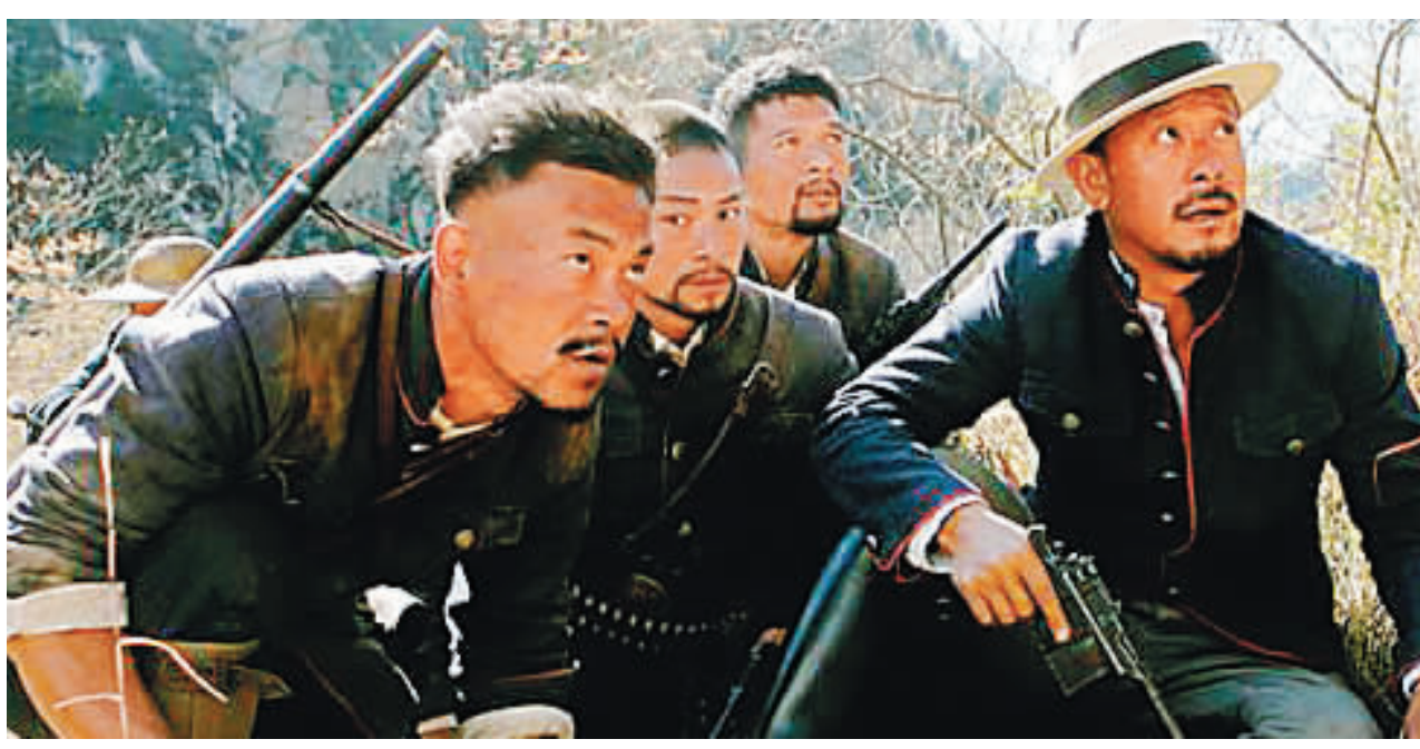
《让子弹飞》影片中的一个镜头。

新华社广州2月25日电(记者赖少芬)首届粤港澳青年电影盛典25日晚在广州闭幕，共评出“最受粤港澳青年欢迎的优秀故事片”等13个奖项。自2010年12月4日开幕以来，这一盛典共放映电影206场，覆盖了外来务工青年、大学生、社区青年、港澳青年等多个青年群体共20多万人次。