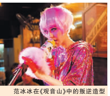
范冰冰在《观音山》中的叛逆造型

本报讯 24日，拿到东京电影节两项大奖的影片《观音山》在京举行了首映活动，导演李玉，影片主演范冰冰、陈柏霖、肥龙、制片人兼编剧方励都出现在首映现场。范冰冰一改影片中的“本真原色”，以火艳红唇搭配灰色西装的惊艳造型，赢得观众掌声。