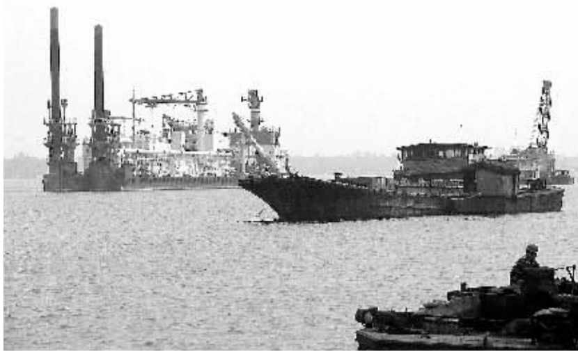
按照规划,清澜港是我省东部地区重要的支线补充港和国家航天发射基地的主要海运枢纽。图为正在建设中的清澜新港。

马村港便宜多少,他三缄其口。类似打价格战的情况也能在其它港口找到。在环北部湾区域内,目前共有广西防城、钦州、北海,广东湛江,海南海口、洋浦等6个港口从事集装箱运输装卸业务。其中海口港集装箱业务独占鳌头,2010年共完成吞吐量61.3万TEU(标准箱),同比增长41%,其余5个港口均低于30万TEU(标准箱)。