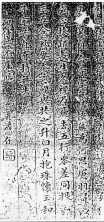
潘存《研传一兄属临册页》墨迹