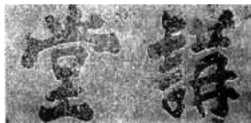
传为潘存所书溪北书院“讲堂”牌匾

据介绍,日本在明治时代以前,流行的都是王羲之之风,自中林梧竹向潘存学习书法之后,特别是潘的弟子杨守敬出使日本,带去了大量的碑版拓片,方使日本人眼界大开,开始学习汉魏书风,遂开创了日本书法多样化的局面。这其中,潘存居功大焉。 [图]