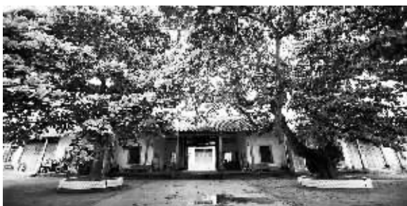
坐落在文昌市铺前镇的溪北书院已有116年的历史。