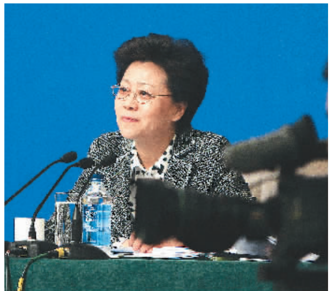
3月8日，全国人大代表、国家民政部副部长姜力在北京梅地亚新闻中心，就困难群众生活救助和养老服务体系建设答记者问。