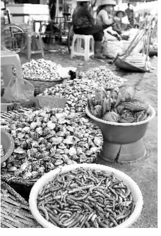
盛产沙虫的儋州市光村镇,市场内只有两盆沙虫出售。

沙虫又叫沙虫肠,生长在沿海沙滩上。虽然名不副实,但其营养、味道及食用价值都不亚于其他名贵海产珍品,是深受海南人喜爱的一道海鲜。可春节前后,沙虫货源少,价格高,让不少市民望“虫”兴叹。海南日报记者通过调查海鲜市场,走访沙虫产地发现,育苗困难、养殖越来越少、养殖周期偏长等原因,阻碍了沙虫养殖业的发展;而市场需求量大,致使野生沙虫也越来越少,一些海鲜经营者痛心称沙虫为“濒临消失的美味”。