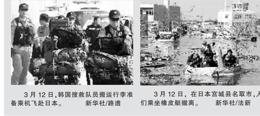
3月12日，韩国搜救队员搬运行李准备乘机赴日本。

日本政府13日加大搜救力度，投入总计10万人进入东北部地震和海啸灾区。其中共16.5万名自卫队员12日晚赶赴灾区，其余3万多人预计今后一两天抵达。 日本厚生劳动省13日晨说，11个县指定接收地震伤员的22家医院满负荷运转，面临断电断水困境。日本共同社13日援引警方的话报道，地震遇难或失踪人数超过2000。重灾区福岛县失踪1167人，宫城县和岩手县邻近太平洋沿岸发现600多具遇难者遗体。 日本东北地区一些医院震后除救治伤员外，成为无家可归者的紧急避难所，电力、食品和饮用水供应吃紧。 《日本时报》13日报道，重灾区仙台宫城野区今年今成医院收治400名伤员，同时开放会议室、大厅供民众避难。院方说，医院自备的发电机可能再维持两天，人工呼吸机可能被迫停用。 同洁(新华社日本东京13日电)