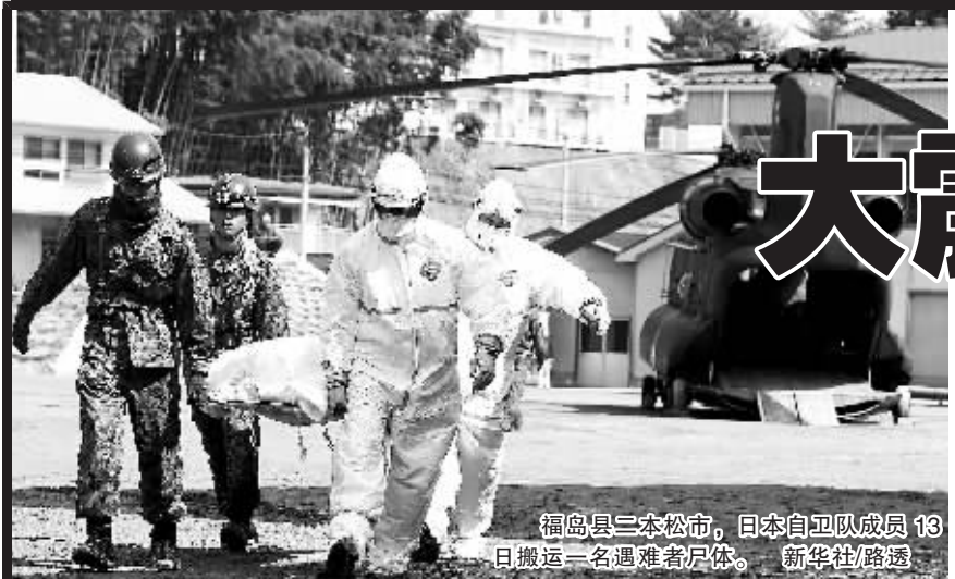
福岛县三本松市，日本自卫队成员13日搬运一名遇难者尸体。