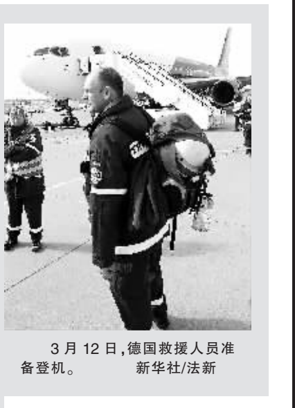
3月12日，德国救援人员准备登机。