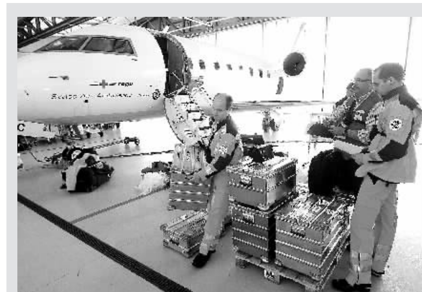
3月12日，在位于瑞士洛腾的瑞士空中救援基地，搜救队员搬运装备准备登机赴日本。

在人类生存的这个蓝色地球上，海洋面积占到地球表面积的71%，而在占地球表面不到三分之一的陆地上遍布着世界230多个国家和地区。日本东北部海域大地震引发的海啸几乎袭击了日本列岛太平洋沿岸的所有地区，并波及到其他国家和地区，造成了人员和财产损失。 海啸引起许多国家的高度重视，包括俄罗斯、菲律宾、印度尼西亚、澳大利亚、新西兰、墨西哥、加拿大、美国等在内的十多个国家和地区都发布了海啸预警并启动预警机制。俄罗斯、菲律宾、孟加拉国等一些国家还疏散了居住在沿岸危险地带的居民。 中国救援队抵日 日本强震海啸发生当天，中国国务院总理温家宝致电日本首相菅直人，代表中国政府向日本政府和人民致以深切慰问，并表示中方愿向日方提供必要的帮助。杨洁篪外长也致电日本首相菅直人表示慰问。 由15名经验丰富的队员组成的中国国际救援队13日一早从北京出发，乘坐民航包机于中午时分抵达东京羽田机场。