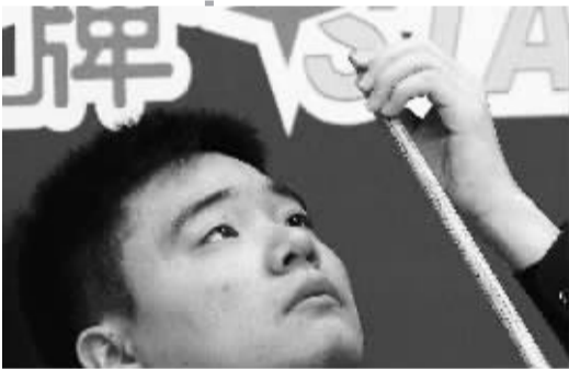
丁俊晖在海南精英赛上表情丰富。

丁俊晖说：“尽管海南精英赛只有短短的 4 天时间，但海南之行让我放松了心情，调整了状态。以后有机会的话，我一定还会来海南比赛。”