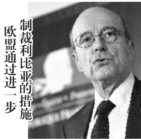
制裁利比亚的措施 欧盟通过进一步

3月21日,在比利时首都布鲁塞尔,法国外长朱佩出席欧盟外长会议后的记者招待会。欧盟外长会议当天通过了对利比亚的进一步制裁措施。