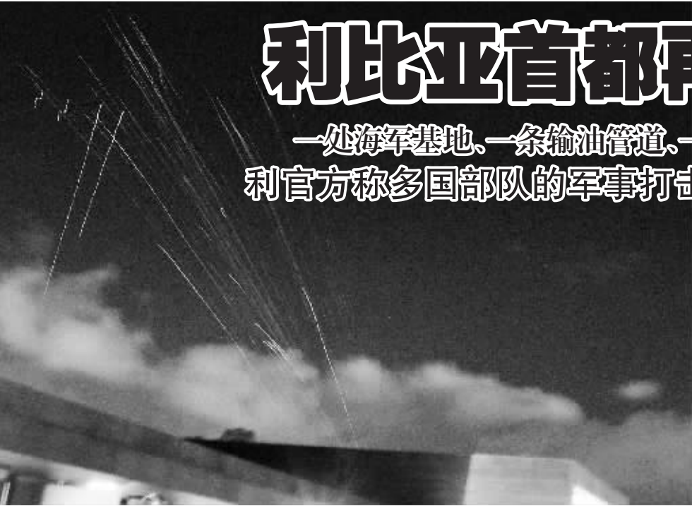
3月21日,利比亚首都的黎波里防空炮火向空中射击。