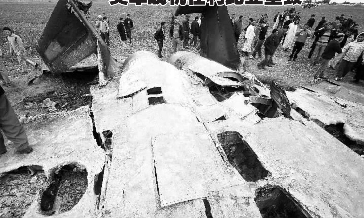
三月二十二日,在利比亚班加西附近,当地居民查看一架坠毁的美国战机。美军非洲司令部一名发言人二十二日说,一架美国空军F-15M型战机二十一日夜间在利比亚执行任务时坠毁。机上两名美军士兵弹射出舱,没有生命危险。