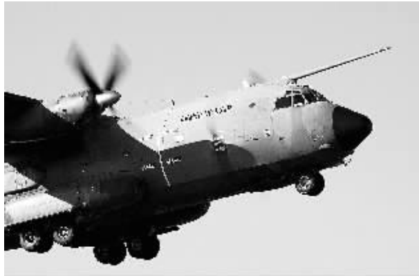
3月21日,法国一辆运输机准备参加代号“哈马丹”的对利比亚的军事行动。

他说,西方国家连续三天对利比亚发动军事打击,而这是在利比亚武装部队已宣布全面停火并停止所有军事行动之后发生的。利比亚大部分民用机场和海港都在袭击中遭到破坏。