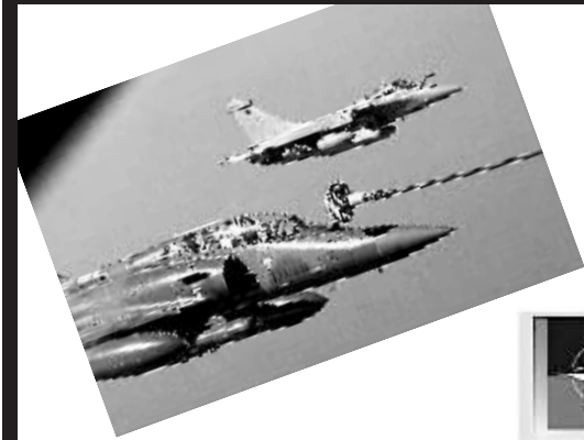
↑法国伊斯特军事基地的一架“阵风”战机(后)和一架“幻影”战机执行针对利比亚的军事行动。

多国部队27日继续轰炸利比亚多个地区,包括首都的黎波里、利比亚领导人穆阿迈尔·卡扎菲的家乡苏尔特等地。 同一天,北大西洋公约组织宣布将从美国手中全面接管对利比亚军事行动。