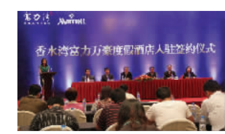
香水湾富力万豪度假酒店入驻签约仪式

端人士提供了全方位的周到服务。巨擘的强强联手不但直接提升了香水湾片区的整体素质, 也极大的扩展了大三亚区域的高端度假直径, 更是丰富了高端度假人士的多元选择。站在国际旅游岛的宏伟蓝图之上, 富力湾与万豪酒店的联手也必将开创世界度假精品的新纪元。