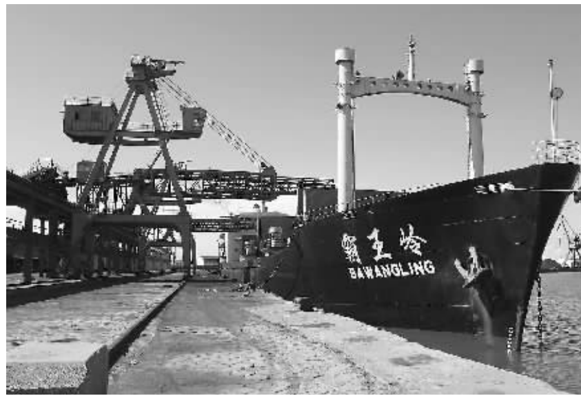
八所港已从过去单一的港口装卸仓储业务板块发展成港口装卸、码头总包及劳务、物流运输等三大业务板块齐头并进的格局。图为“霸王岭”号货轮停泊在码头等待作业。