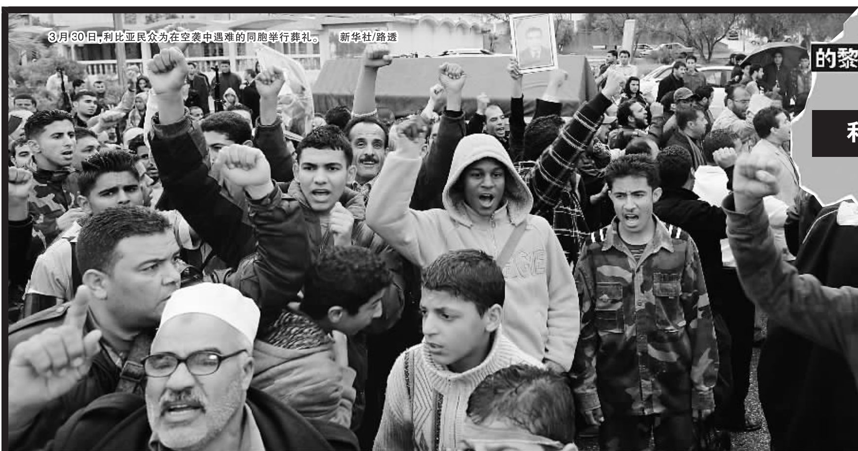
3月30日,利比亚民众为在空袭中遇难的同胞举行葬礼。新华社/路透