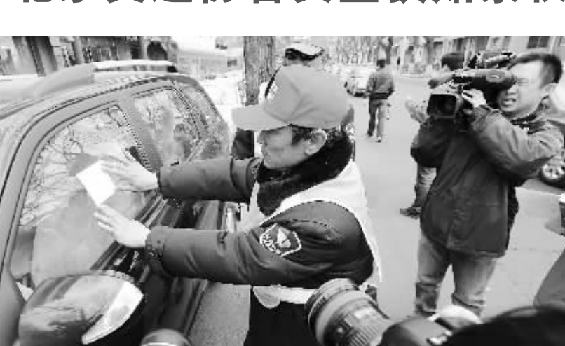
4月1日,北京东单门附近,媒体关注一位交通协管员给违法停车车辆贴“北京市交通协管员道路停车记录告知单”。

“4月1日起,北京交通协管员可对违法停车‘贴条’。”这条应对非法停车行为的措施瞬间引爆网络。短短两小时内,各大网站的评论就已达数万条,“历史的倒退”“是否违法”等质疑声扑面而来,并引发“顶”“踩”两派间的争论交锋。