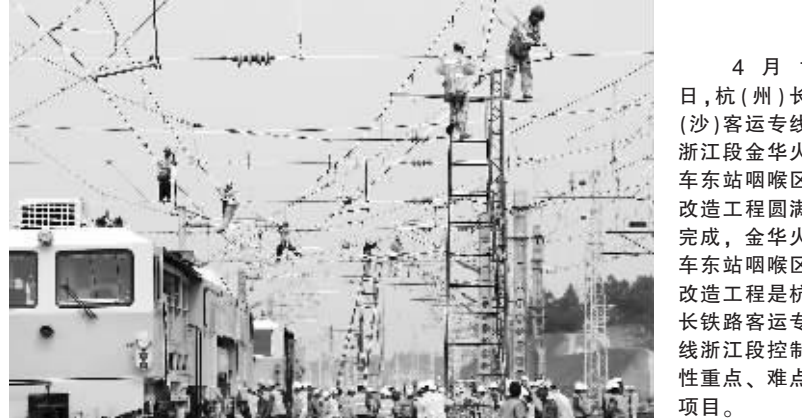
4月1日,杭(州)长(沙)客运专线浙江段金华火车站咽喉区改造工程圆满完成,金华火车站咽喉区改造工程是杭长铁路客运专线浙江段控制性重点、难点项目。 新华社发

原产于美国的排气量在2.5升以上的小轿车和越野车存在倾销和补贴,中国国内产业受到了实质损害,并且倾销和补贴与实质损害之间存在因果关系。