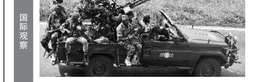
4月1日，支持瓦塔拉的武装人员在阿比让街头驾车前行。

3月31日深夜至4月1日凌晨，支持科特迪瓦前总理瓦塔拉的武装与效忠前总统巴博的安全部队，在位于科特迪瓦首都阿比让的总统府、巴博官邸和国家电视台等多处巴博阵营核心区周围发生激烈交战。