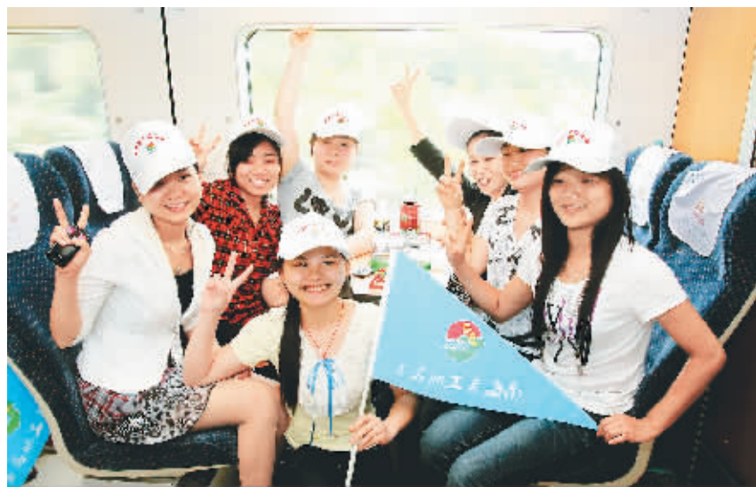
4月8日,“万名职工看海南”活动正式启动,首批270名职工从东环铁路海口东站出发,用3天时间近距离感受海南的发展变化。

“1980年代时,海口到三亚的道路颠簸不平,路面质量也差,当时没有多少班车,我们就坐着解放牌卡车,从海口慢悠悠跑到三亚要8到10个小时,足足花去