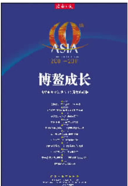
《博鳌成长·博鳌亚洲论坛成立10周年珍藏版》封面

本报今日推出四开112版大型全彩特刊《博鳌成长·博鳌亚洲论坛成立10周年珍藏版》,在海口、三亚、琼海地区随报赠送,敬请读者留意。