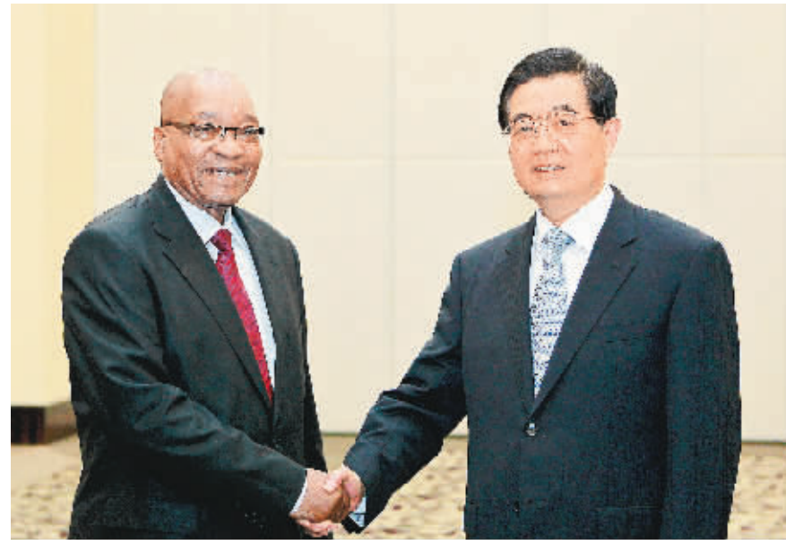
4月13日,国家主席胡锦涛在三亚会见南非总统祖马。

新华社三亚4月13日电(记者刘华、郑玮卿)国家主席胡锦涛13日在海南省三亚市会见了来华出席金砖国家领导人第三次会晤和博鳌亚洲论坛2011年年会开幕式的南非总统祖马。双方就深化中南非全面战略合作伙伴关系及共同关心的国际和地区问题深入交换意见。胡锦涛祝贺南非加入金砖国家机制,表示中方愿同南非和其他成员国一道努力,推动金砖国家合作不断取得新成果。祖马表示,感谢中方支持南非成为金砖国家机制成员,南非加入金砖国家机制使非洲在该机制中有了代表性,这不仅对南非有利,而且对非洲大陆有利。胡锦涛指出,去年8月,两国元首共同签署《北京宣言》,宣布中南建立全面战略合作伙伴关系。半年多来,两国政治交往频繁,相互理解和信任加深,在重大国际事务中保持密切协调和配合。去年,双边贸易额再创新高,两国矿业、金融、电信、新能源等领域互利合作蓬勃发展,科技、文化、教育、旅游等领域交流合作方兴未艾。胡锦涛强调,中南同为重要发展中国家。中南关系全面快速发展符合两国和两国人民根本利益,也有利于促进中国同非洲乃至广大发展中国家的团结合作。中方愿从以下四方面同南非一道努力,深化中南全面战略合作伙伴关系。一是密切高层交往。充分利用双边高层交往,加强治国理政经验交流,巩固在涉及各自核心利益的重大问题上的相互理解和支持,服务两国谋发展、促稳定、惠民生的共同目标。二是深化务实合作。积极落实去年两国高层互访达成的重要共识,深化中南基础设施建设、矿业、能源、农业等领域互利合作,扩大中国金融机构和企业对南非重点领域投资合作,持续推动两国贸易平衡健康发展。三是推动人文交