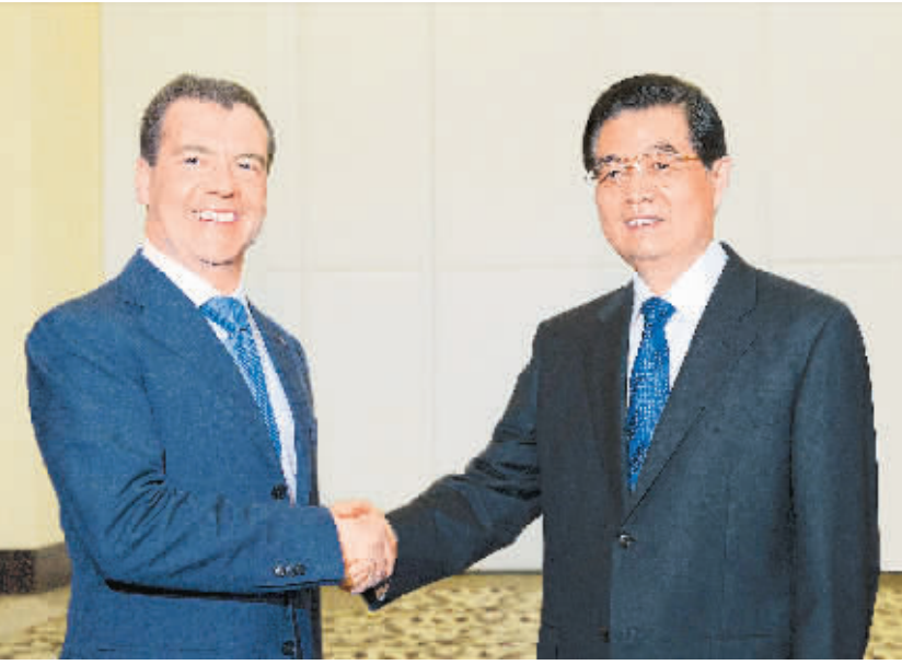
4月13日,国家主席胡锦涛在三亚会见俄罗斯总统梅德韦杰夫。

新华社三亚4月13日电(记者郝薇薇周慧敏)国家主席胡锦涛13日在海南省三亚市会见了来华出席金砖国家领导人第三次会晤和博鳌亚洲论坛2011年年会开幕式的俄罗斯总统梅德韦杰夫。两国元首就双边关系、金砖国家合作及重大国际和地区问题深入交换意见,达成重要共识。双方同意一道努力,推动中俄关系持续健康稳定向前发展。胡锦涛指出,去年中俄两国领导人多次举行会晤,就一系列重大问题交换意见,对全面深化中俄战略协作伙伴关系、扩大两国各领域合作起到重要促进作用。今年以来,中俄关系继续保持良好发展势头。中俄原油管道顺利投产运营,双方成功举行第五轮战略安全磋商,双边贸易额增长势头强劲,双方在国际和地区事务中的协调和配合更加密切。梅德韦杰夫表示,非常高兴来海南出席金砖国家领导人第三次会晤及博鳌亚洲论坛2011年年会开幕式。俄中互为战略合作伙伴,在政治、经济等各个领域保持密切合作,两国高层交往频繁,经贸合作成果丰硕,在国际事务中密切协调配合。俄方对两国关系取得的进展感到满意。胡锦涛指出,当前,国际形势更加错综复杂。中俄双方要坚定不移致力于发展中俄战略协作伙伴关系,维护好两国共同利益,促进世界和平、安全、稳定。双方应该充分发挥两国合作的巨大潜力和优势,重点做好以下四方面工作。一是以共同庆祝《中俄睦邻友好合作条约》签署10周年为契机,大力弘扬两国世代友好的和平理念,增进两国人民传统友谊。二是加大相互政治支持,坚定支持对方维护国家主权、安全、发展利益的努力。三是推进中俄西线天然气管道等能源领域大项目合作,全面扩大