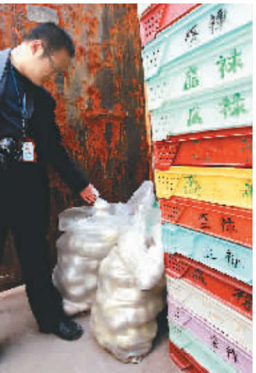
部分从超市回收的馒头堆在仓库一角,原先这些馒头将被再加工后重返市场。

据新华社台北4月13日电 (记者李春南)台湾当局卫生主管部门13日公布的统计数据显示,台湾癌症发生率持续上升。根据最新的癌症登记资料,每6分35秒就有1人被发现患癌,大肠癌是最常发生的癌症种类。此外,男性口腔癌居高不下,女性子宫癌发生率上升。据统计,2008年台湾共有79818人发生癌症,其中男性45171人、女性34647人,较2007年癌症发生人数增加4049人。在台湾地区总人口中,每10万人中有347人被诊断为患有癌症。