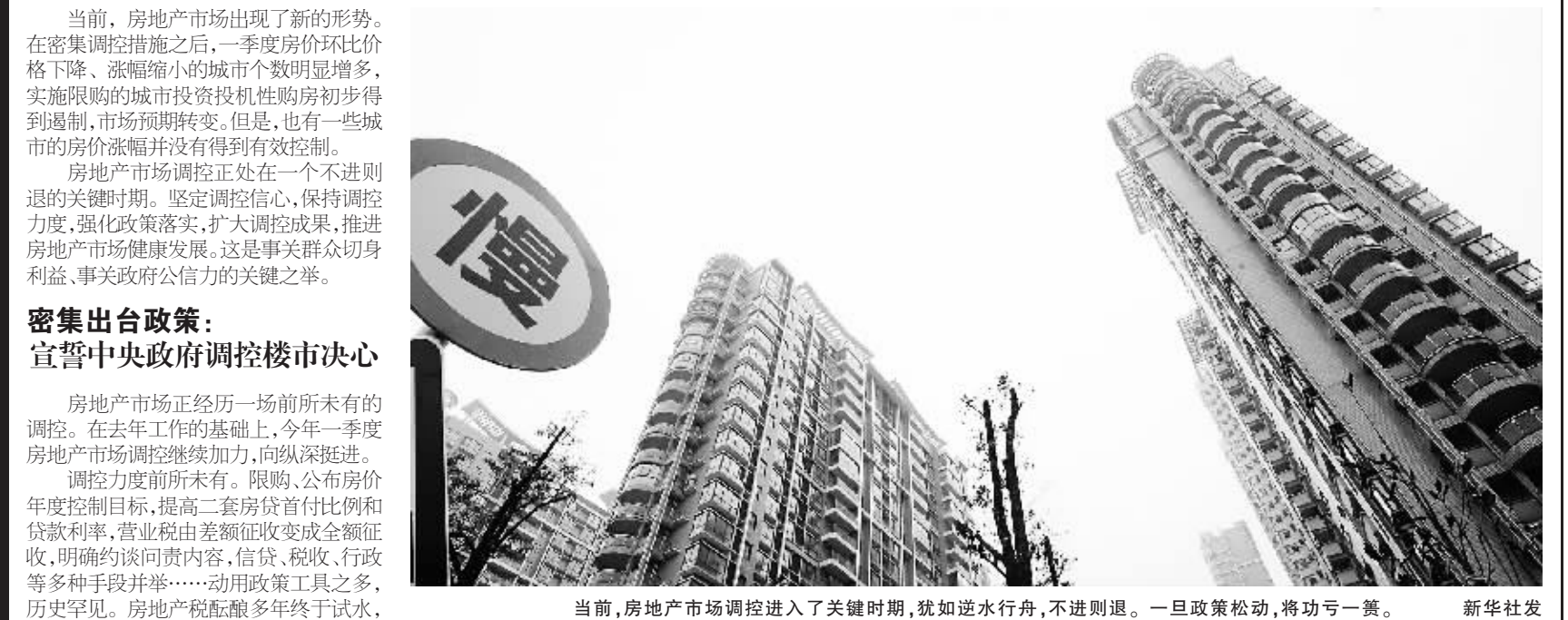
当前,房地产市场调控进入了关键时期,犹如逆水行舟,不进则退。一旦政策松动,将功亏一篑。

当前,房地产市场出现了新的形势。在密集调控措施之后,一季度房价环比价格下降、涨幅缩小的城市个数明显增多,实施限购的城市投资投机性购房初步得到遏制,市场预期转变。但是,也有一些城市的房价涨幅并没有得到有效控制。