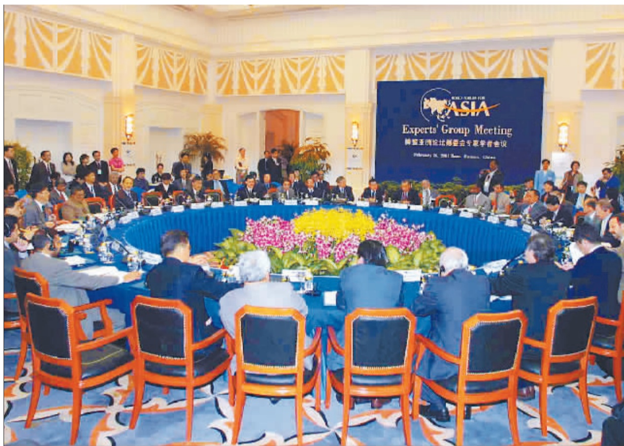
2001年2月26日上午,博鳌亚洲论坛筹委会举办专家学者会议。