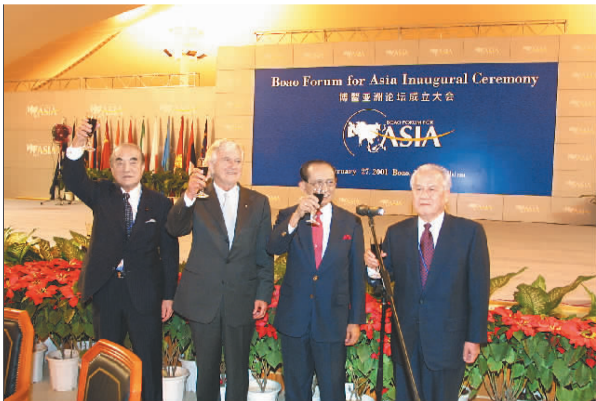
在博鳌亚洲论坛成立大会上,论坛的倡导者举杯庆祝。

金融危机后,亚洲国家需要加强区域经济协调与合作;亚洲地区整体上缺乏组织性;亚洲各国自身的迅速发展以及经济全球化,使亚洲各国面临新的机遇和挑战;亚洲国家需加强与世界其他地区的合作,也要求增进相互间的交流与合作。