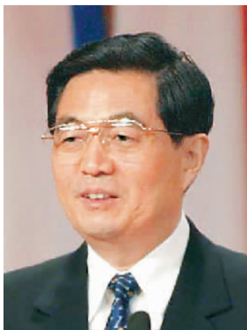
胡锦涛 中国国家主席

和平与发展仍是当今时代的主题，世界要和平、国家要发展、人民要合作是不可阻挡的历史潮流。我们高兴地看到，亚洲形势总体稳定，和平、发展、合作已成为亚洲前进的主流。