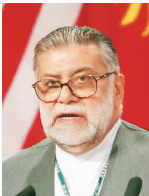
贾迈利 巴基斯坦总理

在区域经济一体化的过程中，每一个国家都需要真诚的伙伴关系；要以一种分享利益和相互信任的精神一起前进，这是东亚和东南亚共赢战略的原则。