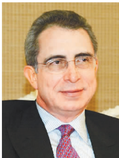
塞迪略 墨西哥前总统

现在世界自由贸易体系已能够让更多的国家受益，一个开放的市场和贸易体系，将给世界人民带来更多的实惠。