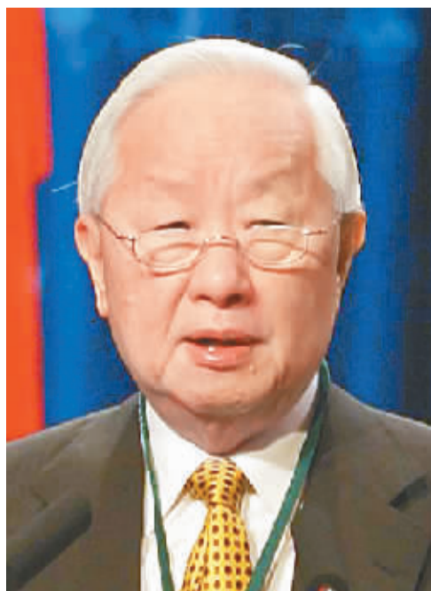
张忠谋 中国台湾积体电路公司董事长

全球化时代，必须尊重不同的文化、传统和价值观。用宽容和耐心来揭示这些不同文化、传统和价值观中的普遍性。