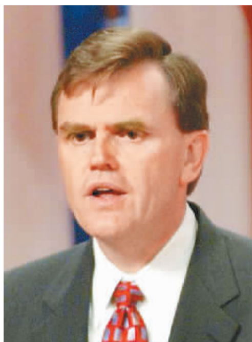
大卫·艾博尼 美国 UPS 总裁