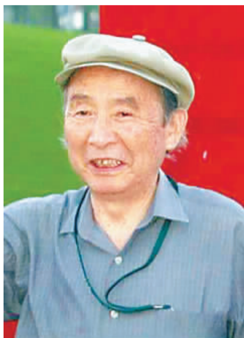
根本二郎 日本邮船株式会社名誉会长

寻求亚洲的共赢，向世界开放，这样一种态度使国际上的那些大的公司同亚洲之间的合作更加紧密。