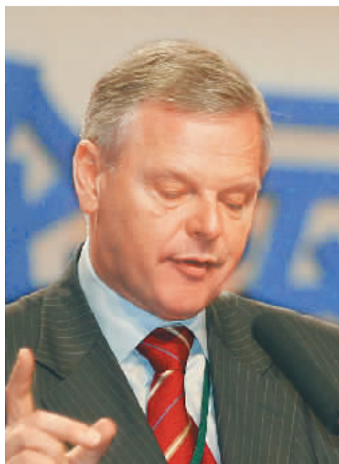
柯兹雷 荷兰飞利浦总裁