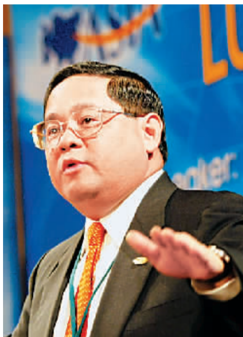
冯国经 香港利丰集团主席