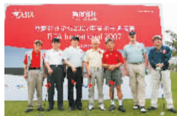
博鳌亚洲论坛2007年高尔夫邀请赛4月20日上午举行。

据了解,该晚宴共获捐善款80多万元人民币,用于重建去年受泥石流破坏的一所菲律宾小学和改善我省边远少数民族地区学校。