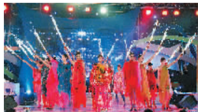
晚宴上的模特表演令人眼前一亮。